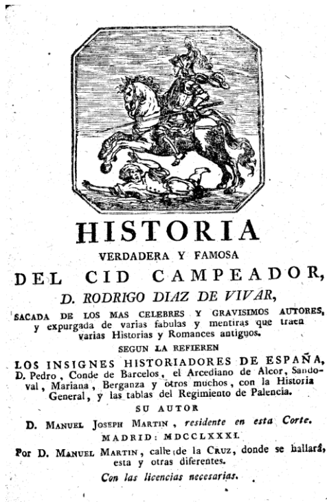
Figura 17: Portada Cid (1781)