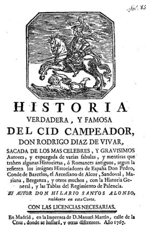
Figura 19: Portadas del Cid . Comparación entre las ediciones de 1767 y 1781