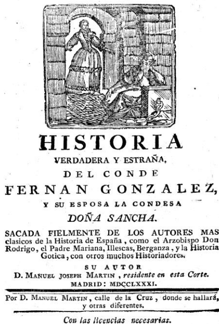
Figura 21: Portada del Fernán González (1781)