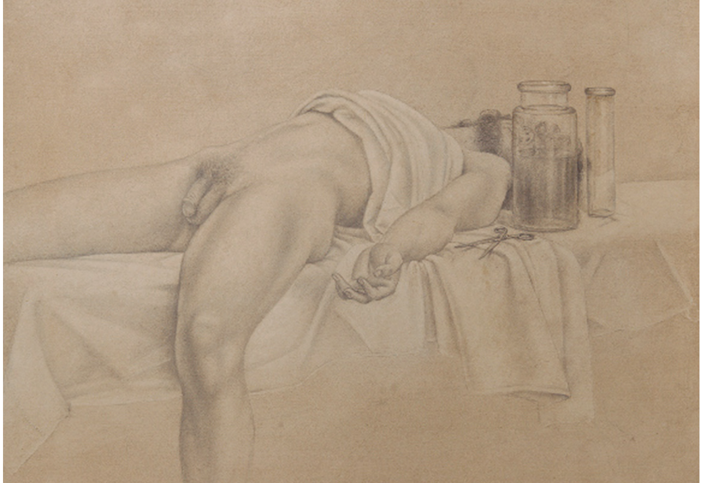
▲ Imagen 4. Estudio para un autorretrato (1977).