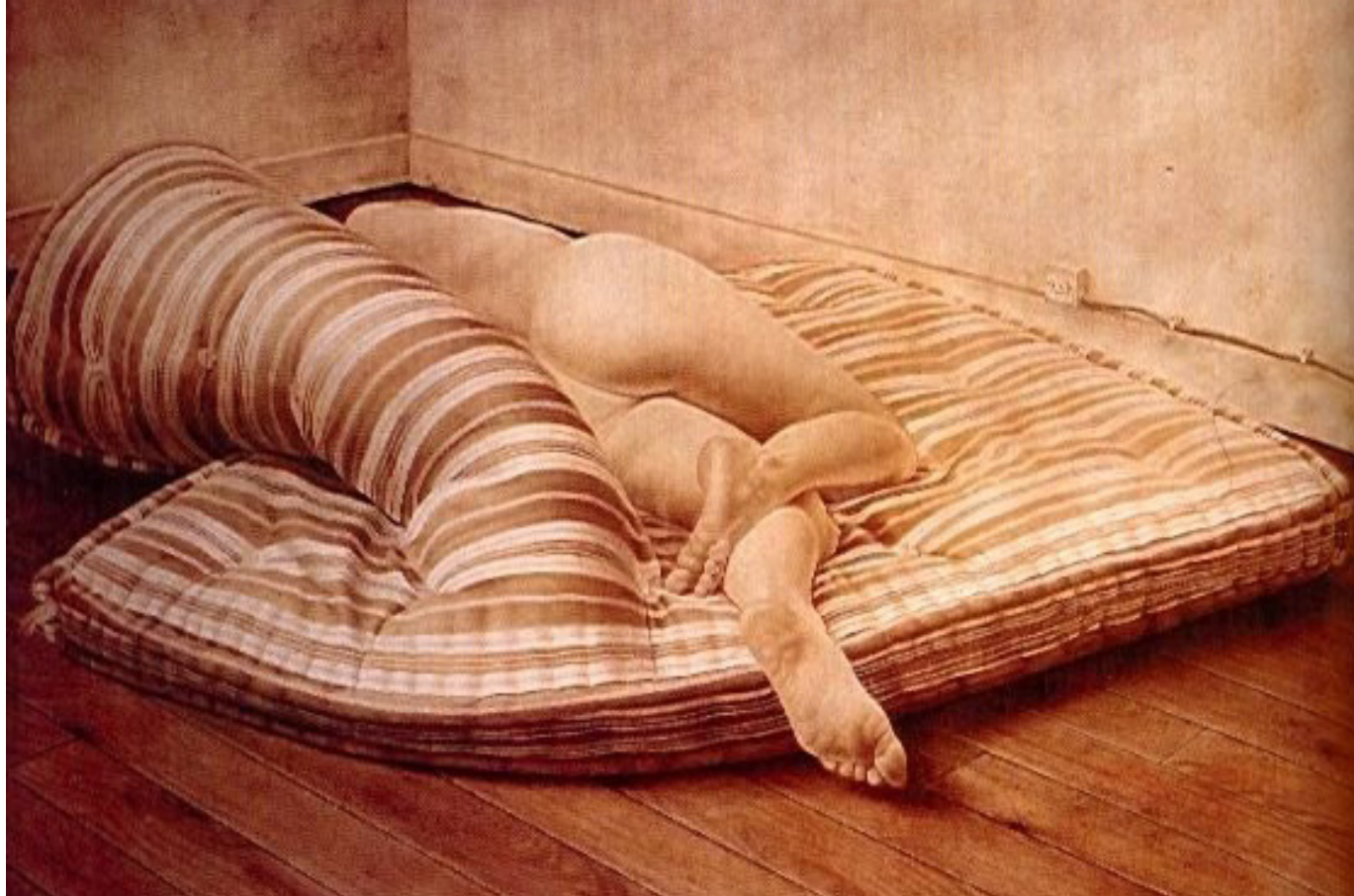
▲ Imagen 2. Mujer acostada en colchón (1975)

al enmarañado repertorio de nuestra imaginación, en el cual cocinamos el temor a lo desconocido. De este modo, quedamos a medio camino entre lo real y lo irreal, entre los cuerpos que vemos y los que imaginamos, y en este punto la deriva nos hace “desplazarnos más allá de la conciencia y cuestionar nuestra integridad y seguridad” (Cortés, 1997) para replantear nuestra propia corporeidad como seres vulnerables y temerosos ante estos cuerpos incompletos que pudieron aparecer fruto de la materialización de algún deseo reprimido, un accidente o algún tipo de anomalía biológica, y reposan en un espacio como los nuestros. Presentados ante nosotros de una manera limpia, absolutamente estilizada y sensual, con minucia técnica, bajo la lupa de una obsesión por la re-presentación de estos cuerpos ambiguos, en los que “La monstruosidad ya no es un desorden ciego, sino otro orden igualmente regular, igualmente sometido a leyes: el monstruo obedece a la ley común que rige el orden de lo vivo” (Courtine, 2006).