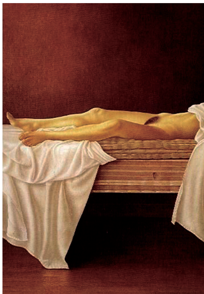
▲ Imagen 3. Desnudo acostado en la cama con sábanas (1977).

6. “Agreguemos que si el concepto de claritas (claridad) tuvo un papel significativo en la Edad Media fue porque designaba tanto el fenómeno físico de la luz como el ‘resplandor de la virtud’, el esplendor del alma que luce en el cuerpo. En este sentido, reconocía Tomás de Aquino que la claridad del cuerpo provenía de la claridad del alma” (Oliveras, 2005).