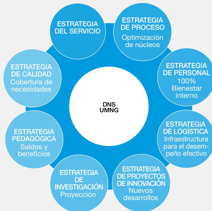
Gráfica No 1: Ciclo estratégico del bienestar universitario.