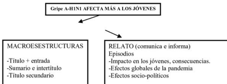
Figura 2.1. El propósito comunicacional y selección de estructuras -resumen