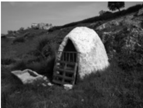
Lám. XVIII. Pozo Cortijo la Higuera.

En el primer tercio del pasado siglo XX, bajo la dictadura de Primo de Rivera, ocupando el Ministerio de Fomento D. Rafael Benjumea (conde de Guadalhorce), se acometió una gran obra pública o línea de ferrocarril que discurría por la sierra gaditana desde Jerez de la Frontera hasta Almargen, siguiendo el trazado por la zona noroeste de Cañete la Real. Tal obra no llegó a concluirse, aunque se realizaron diversas construcciones tipo túneles, pilas de puente (sobre el río Corbones), etc., que se conservan en el municipio (lám. XX).