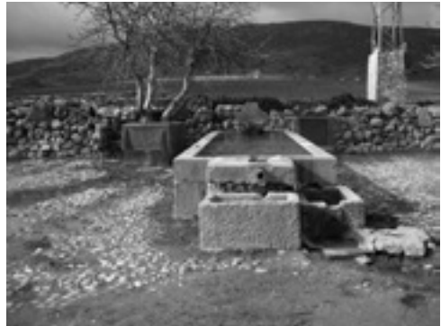
Lám. XIII. Fuente abrevadero Cortijo de la Colada.

Situación parecida anuncia el Cortijo de la Colada, que añade a determinadas condiciones materiales expuestas para el anterior, una magnífica chimenea troncopiramidal, también acompañado de escudo heráldico. Algunas de estas familias vivirían por lo común en ciudades y pueblos relevantes de nuestra geografía regional, pudiendo residir temporalmente en el propio latifundio o en el casco urbano de Cañete la Real, probablemente en los alrededores o en la misma calle San Sebastián, donde se ubican excelentes hábitats domésticos de portadas blasonadas.