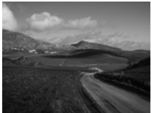
Lám. XIX. Camino Bajo de Cuevas del Becerro.