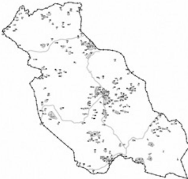
Fig. 1. Ocupación humana diacrónica del territorio (dibujo Pepa Arrabal).