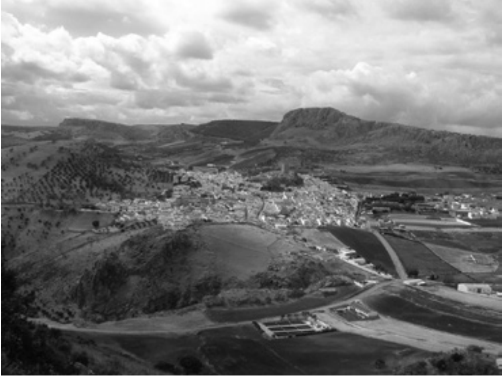
Lám. I. Casco urbano de Cañete la Real.

tas, medievales o feudales (islámicas, cristianas) y capitalistas 5 . Respecto a 1993 conviene subrayar algunos aspectos novedosos, relativos