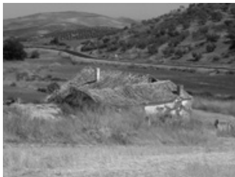
Lám. XXI. Venta del Ciego.

Otros hitos culturales característicos del paisaje que vivieron nuestros ancestros fueron las ventas, posadas o fondas. En Cañete se conocen varias, casi todas en desuso y ruina, casos, entre otras, de Venta de la Atalaya, Venta del Ciego (lám. XXI) y Venta de “Virján”, sobre la Cañada Real de Ronda a Granada 37 . Suelen ubicarse junto a caminos reales, veredas o cañadas, y a veces combinan las funciones de albergue para personas y animales con otros usos agrarios, ganaderos, de olivar, cereal de secano, etc., o también de lagares y lugar de celebración de fiestas populares e incluso contrabando, configurándose en este último caso como una de las mixtificaciones más interesantes, narradas por los antiguos viajeros.