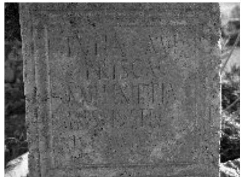
Lám. VII. Inscripción funeraria en Cortijo Ortegicar.