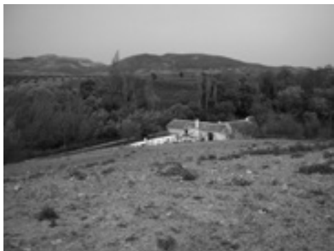
Lám. XVI. Molino de Ortegícar.