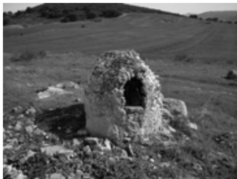
Lám. XVII. Horno de pan Cortijo la Higuera.

y cocción, ésta última con cúpula hemiesférica, de ladrillo o piedra refractaria, respiradero o chimenea. Los materiales empleados son los que ofrece la naturaleza más cercana, de mampuestos, ladrillos y tejas para la cubierta, unidos con argamasa de cal, arena y barro. Más raros son los de planta circular y exentos, caso del Cortijo de la Higuera (lám. XVII), personificando una tendencia que observamos en determinados pozos (lám. XVIII).