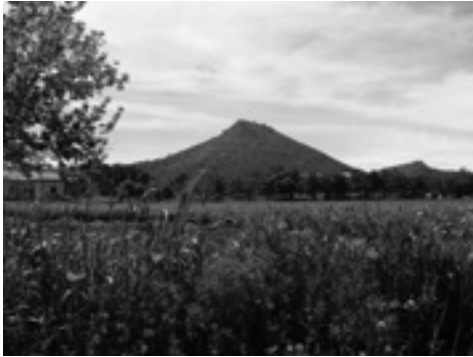
Lám. VIII. El Atalayón.