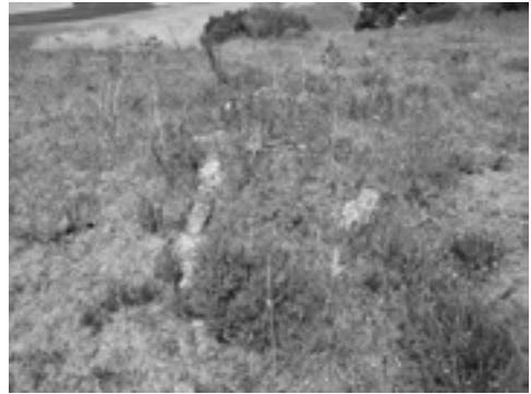
Lám. III. Dolmen de Las Higueras.

Más copiosas son las producciones líticas analizadas, concierne a grupos sociales con tecnología específica de tipo modo-3 (Paleolítico Medio o Musteriense). Actividades antrópicas sobre artefactos líticos en esta fase del proceso histórico se han constatado a través de prácticas arqueológicas desarrolladas en las terrazas del Arroyo de la Fuentezuela, donde se estudiaron depósitos aluviales