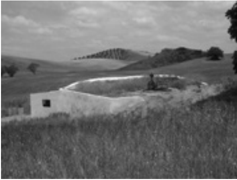
Lám. XIV. Noria de Pachón.

se le añade una mina lateral de captación. La planta suele ser circular en el fondo y rectangular, estrecha, de lados menores redondeados, en el alzado interno, debido a la conveniencia de obtener un espacio adecuado y vertical por donde circularán los artilugios que extraen el agua (cangilones). La noria cabe rodearse de una plataforma externa, circular y elevada, sobre la cual girará el animal que genera la potencia deseada para la subida del líquido. Los nuevos desarrollos tecnológicos han aparcado la energía animal, sustituyéndola por motores de gasoil y electricidad.