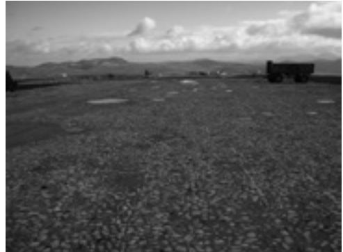
Lám. XV. Era Cortijo de la Colada.

En cuanto a los molinos de aceite, en ellos las torres y muros de contrapeso fueron elementos estructurales imprescindibles en los sistemas tradicionales de prensado de la aceituna y, por tanto, aparecen en la composición arquitectónica de las almazaras anteriores a la modernización industrial del siglo XIX, aunque puedan ser utilizadas con posterioridad. A partir del siglo XVIII, las muelas cilíndricas verticales se trocarán por otras troncocónicas, que muestran un mejor beneficio al ser más grande la línea de contacto, por lo que también se obtiene mayor cantidad de aceituna molturada. Es la adopción del denominado “sistema Pleiffer, que consiste en incorporar las piedras cónicas y una tolva central, o bien lateral