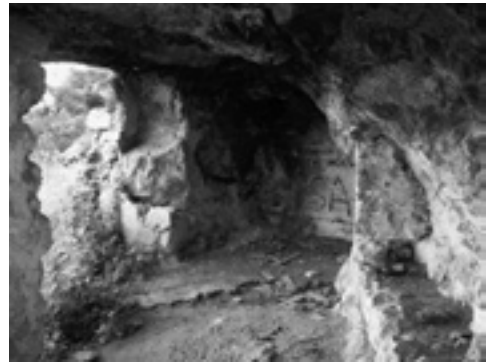
Lám. XI. Hoyo Cruz.

Relativo a la conservación del PA, si exceptuamos el Castillo de Cañete, en el que se efectuaron labores de acondicionamiento general bajo la dirección del prof. Fernández López, la inmensa mayoría