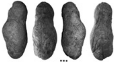
ÍDOLO DE CERRO SÁBORA - CAÑETE LA REAL (Málaga)

Lám. IV. Escultura bisexual de Cerro Sábora.