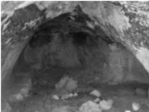
Lám. X. Cueva del Santón.

Estos son a grandes rasgos los centros arqueológicos documentados, que avalan la ocupación humana de estas tierras desde el Paleolítico hasta hoy. Parte estimable de este legado se expone en el Centro de Interpretación “Los Vigías del Territorio”, sito en la reconstruida Torre del Homenaje del Castillo, en pleno casco urbano.