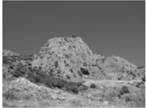
Lám. V. Cueva de Viján (arriba torre).

Lám. IV. Escultura bisexual de Cerro Sábora.