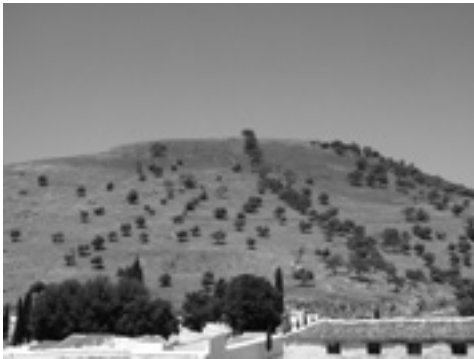
Lám. VI. Oppedium de Cerro Sabora.

La facies Ibérico Final/Iberorromano (siglos III-I a.n.e.) viene determinada por la conquista romana, cuyas primeras muestras materiales quedan expresadas por los fragmentos de cerámica republicana de barniz negro Campaniense-A, documentados en determinados enclaves indígenas, ejemplos del referido Cerro Sabora o en la Herriza del Arroyo de la Fuentezuela 23 , con parámetros urbanísticos similares, en principio, a los del Ibérico Pleno, avanzando hacia el Proceso de Romanización, para confundirse con un modelo social más o menos asimilado (aunque conservando aspectos concretos de su cultura material y producciones ideológicas/espirituales) con los moldes transalpinos, hasta bien entrado el Imperio, como demuestran los restos cerámicos de tsg y tsh , que acompañan a las últimas manifestaciones indígenas de la cerámica ibérica pintada con barniz rojo vinoso, observadas en el enclave que nombramos Camino Bajo de Cuevas del Becerro.