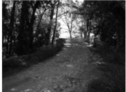
Lám. IX. Puente Guadalteba. Calzada alomada.

Torre de Viján (lám. V) y El Atalayón (lám. VIII), enlazados visualmente entre sí y con otras fortalezas extramunicipales, ejemplos de Cerro del Castillejo 29 (Cuevas del Becerro) y La Torre (Teba). Como eremitorio mozárabe se viene definiendo las estructuras excavadas en la roca de la Cueva del Santón 30 .