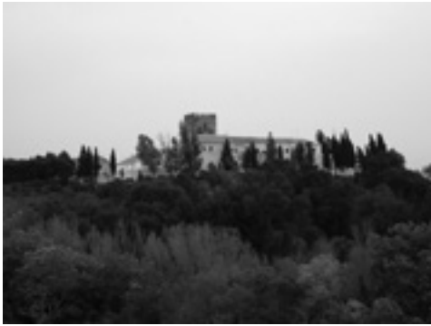
Lám. XII. Castillo y Cortijo de Ortegícar.

mejores suelos. La gran propiedad se refleja sin ambages (además de otros) en el Cortijo de Ortegícar (lám. XII), latifundio que se expresa y visualiza en la gran construcción edilicia plasmada en el lugar, con estancias dedicadas a vivienda del dueño, capataz, cocina, sitio de culto, etc., así como la Torre de Ortegícar, que forma parte del castillo de igual nombre, donde perduran algunos tramos de muralla. Al exterior de la residencia se disponen otros complementos necesarios al normal desarrollo del proceso productivo, ejemplos de era, abrevadero, molino, etc. La categoría social de la propiedad se remarca por la existencia de un escudo heráldico sobre la portada de acceso.