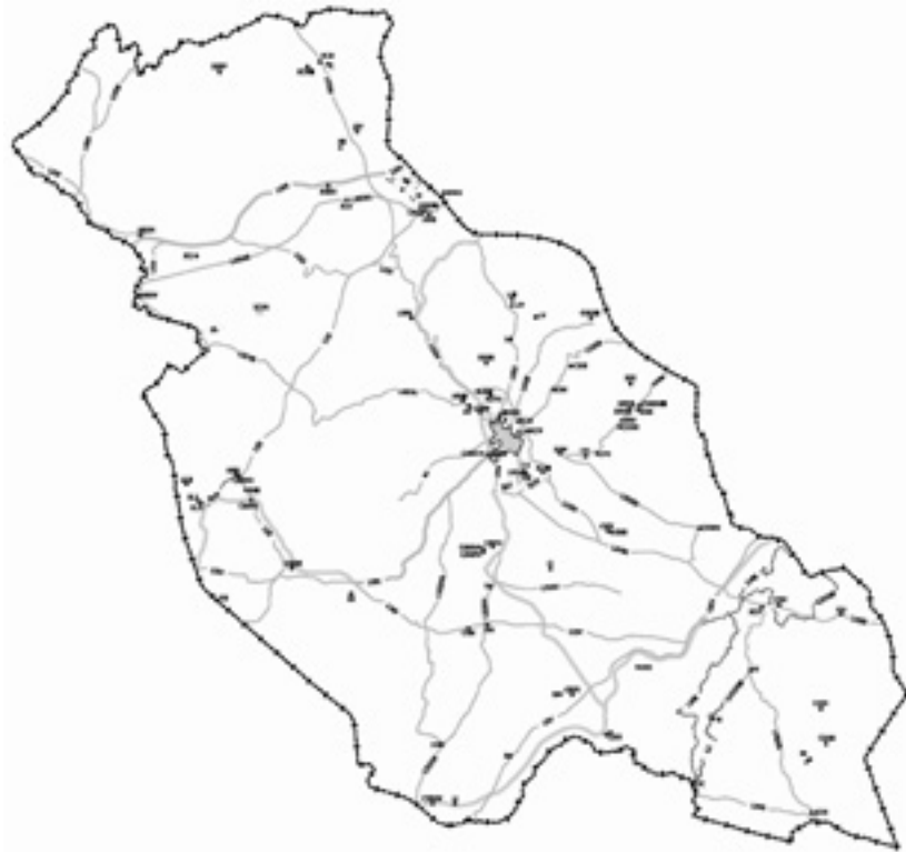
Fig. 2. Localización del PE en el municipio (dibujo Pepa Arrabal).

Entre los edificios religiosos cabe destacar diversas iglesias, conventos y ermitas 38 , ejemplos de: Parroquia de San Sebastián 39 , Convento de Carmelitas, Convento de San Francisco, entre otros.