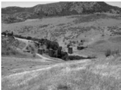
Lám. XX. Ferrocarril desmantelado.