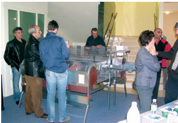
Los descansos de las sesiones se aprovecharon para comentar la situación del sector.