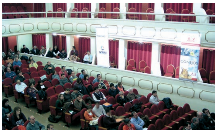
El simposio tuvo lugar en el Teatro Ideal de Calahorra.

con el patrocinio de Laboratorios HIPRA, S.A., Cargill, Laboratorios OVEJERO y del INIA y el Ayuntamiento de Calahorra. El objetivo de esta acción formativa fue estudiar los aspectos más importantes que son necesarios controlar para maximizar los beneficios de las explotaciones. Las implicaciones que tiene la mejora genética de la cabaña, o el manejo del macho y la manipulación del semen fueron temas que se tra-