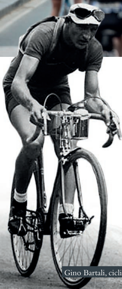
Gino Bartali, ciclista italiano.