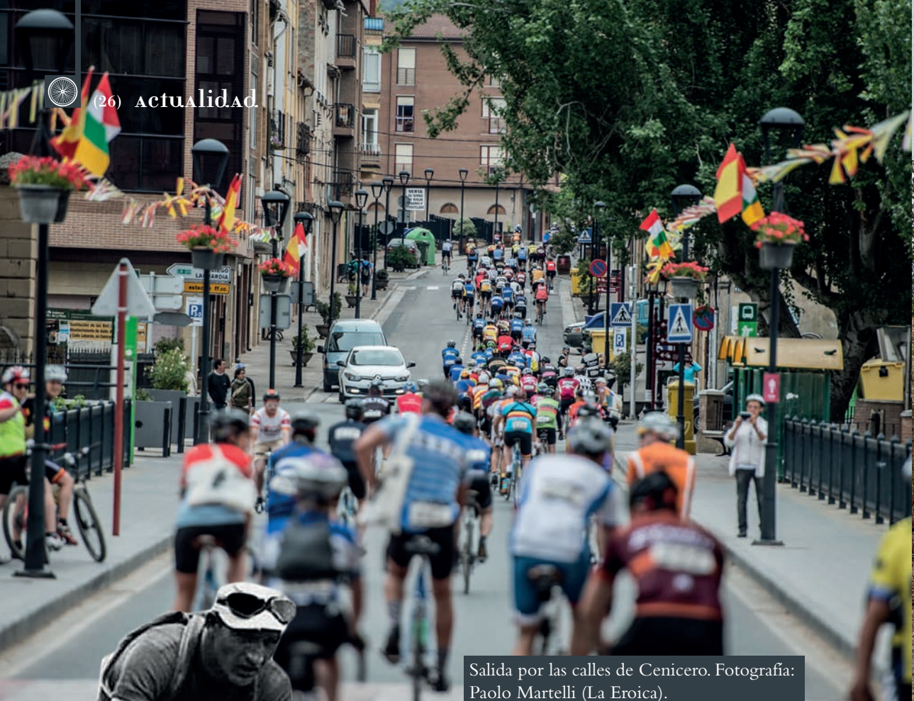
Salida por las calles de Cenicero. Fotografía: Paolo Martelli (La Eroica).