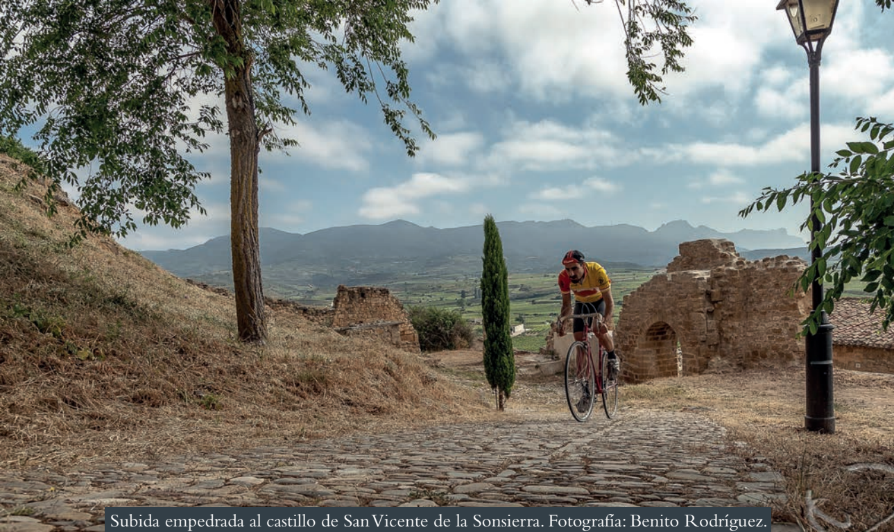
Subida empedrada al castillo de San Vicente de la Sonsierra.

de Clip (Tarragona), La Histórica (Soria), El Gran Premio Canal de Castilla (Palencia) y la Biciclásica Edoardo Bianchi (Zaragoza). Cada año se suman nuevos participantes, que atraen la atención y los flashes de cientos de curiosos, conformando una estampa auténtica -totalmente vintage - por allí por donde transitan.