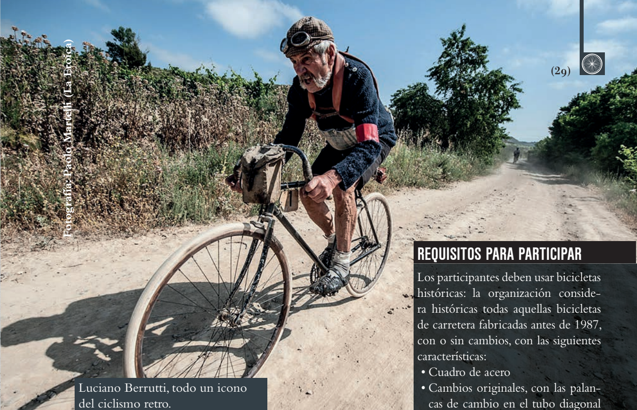
Luciano Berrutti, todo un icono del ciclismo retro.