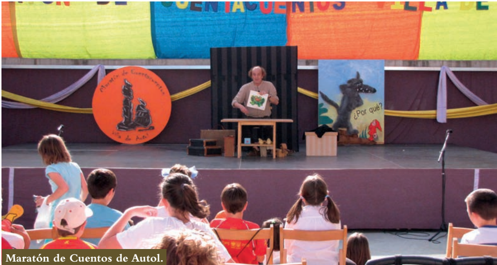
Maratón de Cuentos de Autol.

que de forma itinerante iban por caminos, mercados y pueblos realizando diversas actividades artísticas: música, baile, malabares, adiestramiento de animales..., pero que tenían como base la narración. Solían ser espectáculos individuales o de dos personas (bululú o ñaques). En algún momento de este periodo aparecieron las compañías de cómicos (de la legua y de corral de comedias) que comenzaron a sustituir a los que utilizaban básicamente la narración. En el siglo XVIII ya solo encontramos los romanceros y repentistas, los primeros cantando o recitando romances de forma ambulante y vendiendo los romances en papel (los romances de cordel). Los segundos no tenían un carácter tan ambulante, moviéndose en un territorio más reducido, acudían a fiestas, bodas, bautizos... En el siglo XIX ya solo encontramos a los vendedores de romances de cordel (que recitan también los romances) como profesionales de la narración