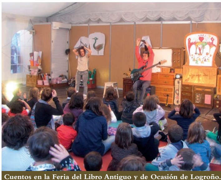
Cuentos en la Feria del Libro Antiguo y de Ocasión de Logroño.

Por otro lado, la narración oral que es dirigida al público infantil ha ganado espacios que estaban ocupados por titiriteros, payasos y teatros, como las fiestas patronales, programaciones vecinales, museos..., incluso piscinas. Si bien su cometido es meramente lúdico, sin tener la carga de valores que habitualmente desempeñaba este oficio.