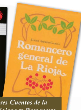
Los 99 mejores Cuentos de la Tradición Riojana y Romancero General de La Rioja.

La narración oral ha estado presente en la vida de los seres humanos desde sus inicios. Como forma de explicar el entorno natural, la propia existencia humana y sus relaciones, los cuentos y mitos fueron las primeras formas narrativas que podemos encontrar.