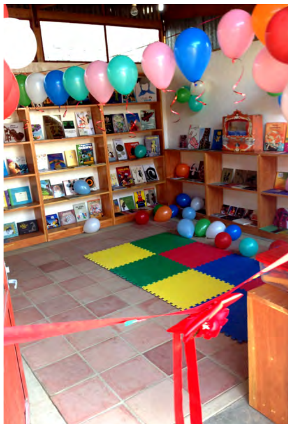
Inauguración de la biblioteca infantil.