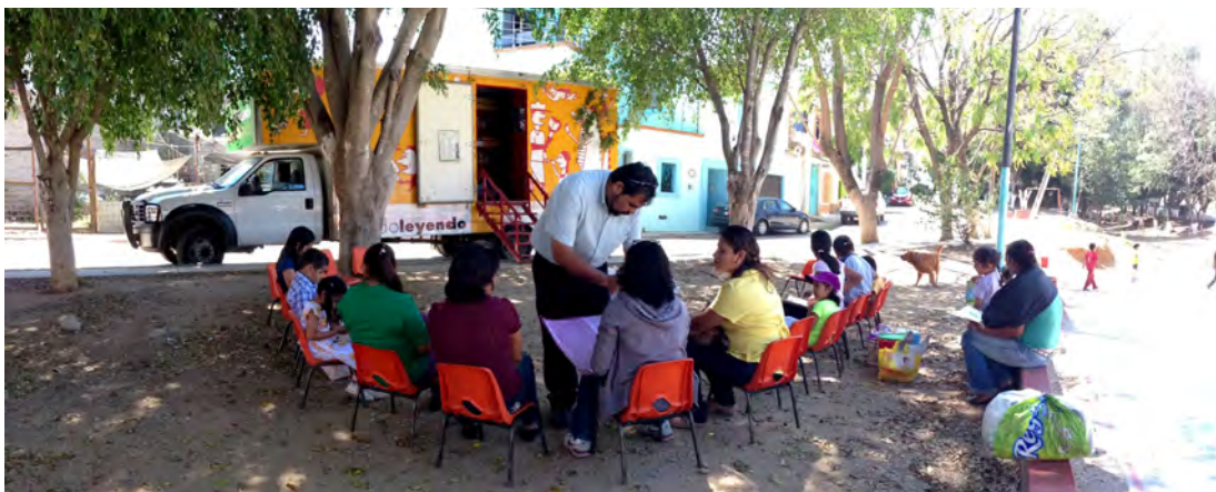
Biblioteca móvil en la colonia Azucenas.