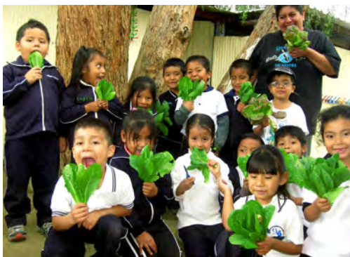
Lechugas de la huerta urbana del jardín de niños.