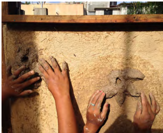
Mezcla de tierra, cal y hoja de pino.