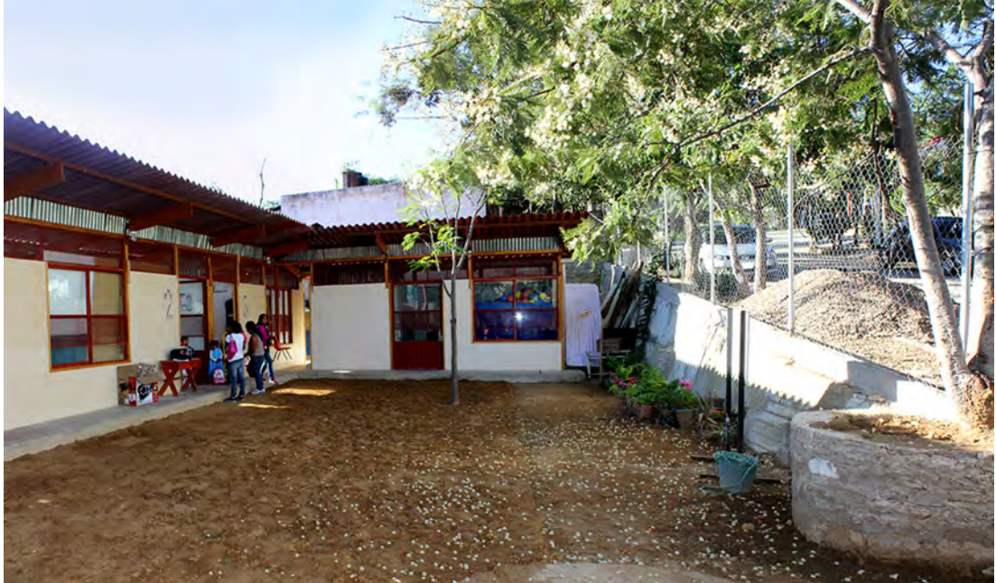
Etapas del proyecto: visita del sitio, participación ciudadana, construcción participativa, arquitectura sostenible.