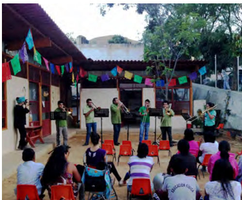
Eventos en el patio de la nueva escuela.