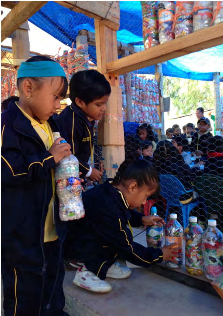
Participación de otras escuelas de la ciudad en la realización de ecoladrillos.