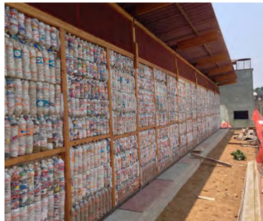
5000 ecoladrillos para la realización de la escuela.