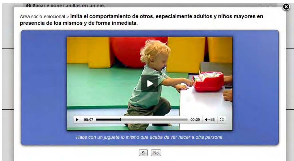
Figura 2 Ventana asociada al ítem con vídeo incluido