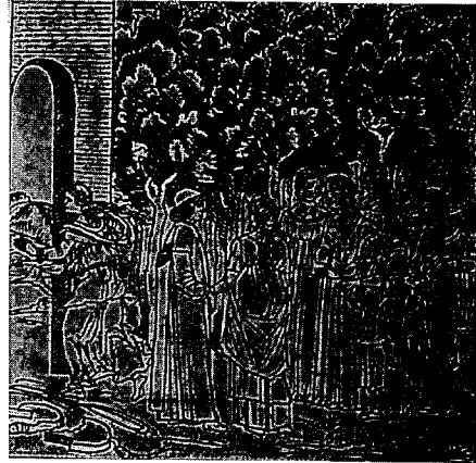
Francesco Colonna: Hypnerotomachia Poliphani . Venezia. Aldus Manutius, 1499.

— Al frente de las Bibliotecas de Centro hay un director, que dirige y