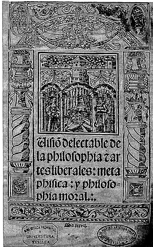
Alfonso de la Torre: Misión delectable de la Philosophia... Sevilla: J. Cromberger, 1538.