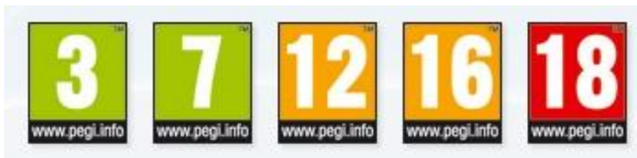
Imagen n.º 1: categorías por edades

Nada más acceder a la web de PEGI, en la parte superior derecha de la pantalla, podemos observar los códigos establecidos como recomendaciones según la edad de los usuarios de los videojuegos. Las categorías son recomendaciones a partir de 3, 7, 12, 16 y 18 años de edad. Ver imagen n.º 1.