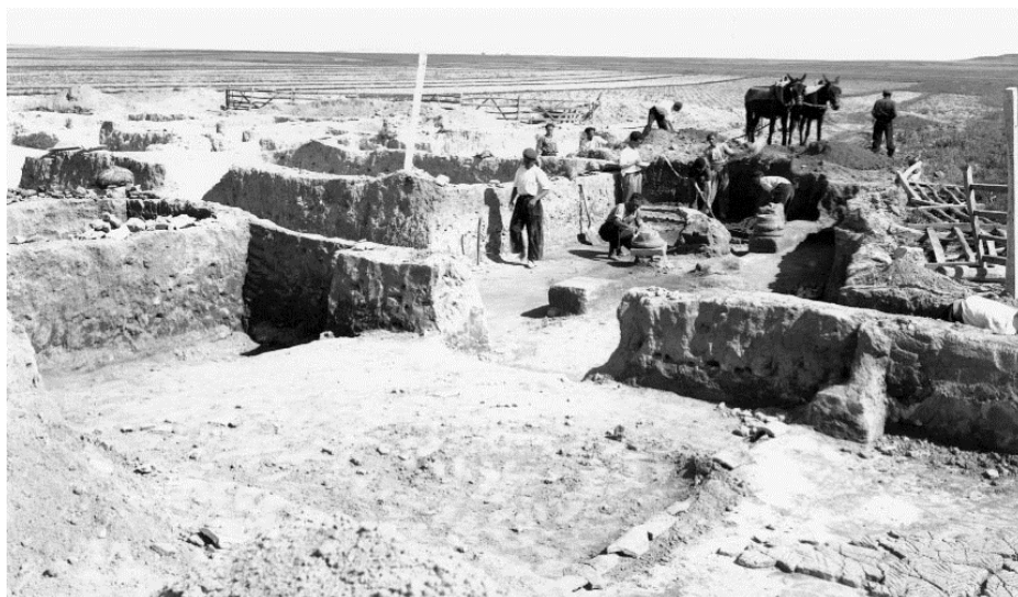
Fig. 1: Excavaciones de G. Nieto. 1942.

villa , la peligrosidad del impacto de las nuevas tecnologías agrarias, la concentración parcelaria y la mejora sustancial de las condiciones económicas del país, todo ello, digo, invitaba, mejor dicho, urgía –después del comienzo un año antes de las excavaciones de La Olmeda, con capital privado– a efectuar una operación similar en la provincia. La Universidad de Valladolid era entonces todavía la única de la región con una cátedra de Arqueología Clásica, razón de más para que el Seminario de Arte y Arqueología y la Diputación Provincial llegasen a un acuerdo de intervención, toda vez que P. de Palol, director a la sazón del Departamento lo era asimismo de las excavaciones de la villa palentina de La Olmeda.