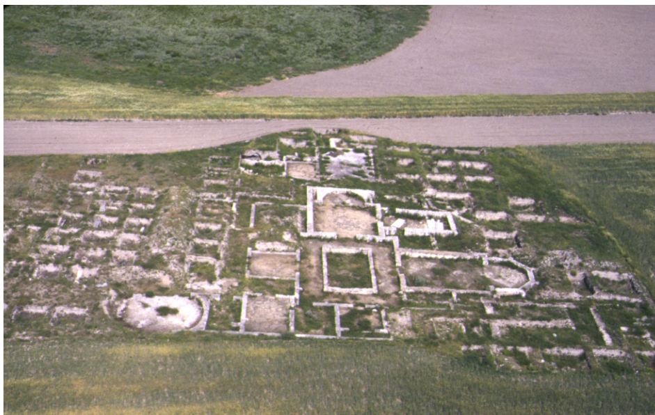
Fig. 2. Vista aérea de las excavaciones de Almenara hacia mediados de los 80.

Supervisadas por G. Delibes y F. Romero, dichos trabajos se dieron a conocer en un artículo (Romero, 1980: 137-152.) y una tesis de licenciatura, que pasó luego a imprenta (Balado, 1987: 169-177; 1989) 13 . Según éstos, el espacio habitado del enclave arrancaría probablemente en el Neolítico, y de forma más segura y continuada en el Calcolítico Campaniforme (Cogotas I) y en el Hierro I, aprovechando los recursos hídricos del lavajo próximo al yacimiento (López Merino et alii 2009: 333-347), como luego haría el establecimiento romano.