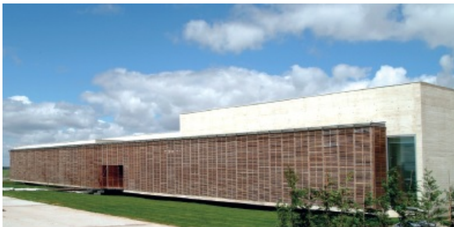
Fig. 4. La Calzadilla. Almenara de Adaja. Museo de las Villas Romanas (MVR).

Las palabras fueron las mismas, y –mutatis mutandis– las fotos y la orquestación de prensa. El proyecto 17 se hacía público el 26 de febrero de 1997, ciento diez años después de los pioneros hallazgos, con una novedad esperanzadora, la voluntad política se expresaba, por vez primera, en términos contables: presupuesto de 262.381.612 pts. y seis años para su ejecución 18 .