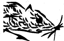
Ilustración Jaime Medina.

Creado en 1962 por la Comisión Católica Española de la Infancia (CCEI). Se concede anualmente al mejor libro infantil y juvenil editado en España. Premio honorífico en el que se entrega una medalla al editor; y al autor e ilustrador sendos diplomas. Se concede el tercer domingo de Mayo: Día Universal del Niño.