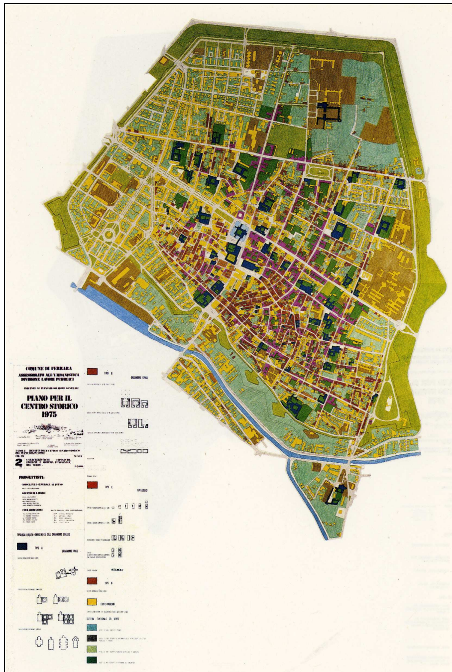
Ferrara, Centro Storico (1975). Análisis de las características tipológicas