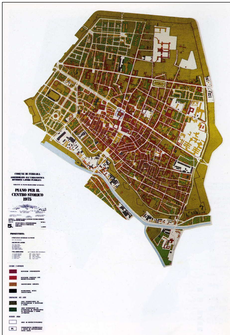
Ferrara, Centro Storico (1975). Programa de conservación del patrimonio arquitectónico