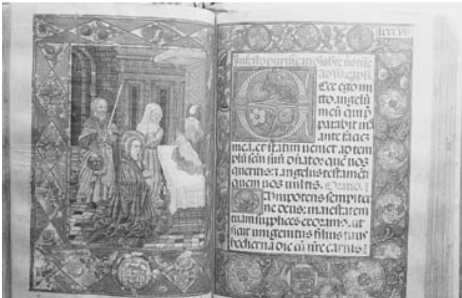
FIG. 2. Purificación de la Virgen , fols. 86 vto. y 87 recto del Diurnal del Monasterio de Guadalupe.