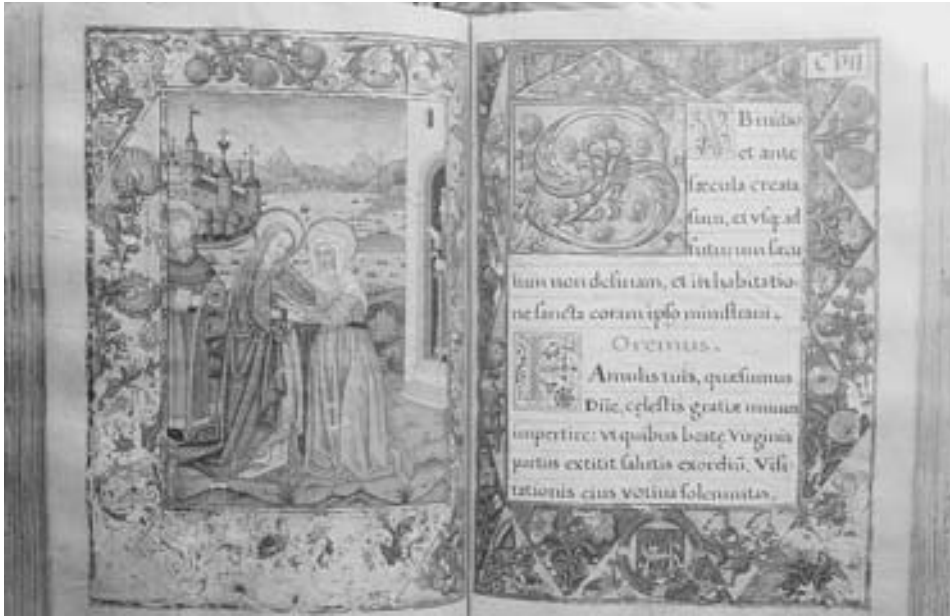
FIG. 1. Visitación , fols. 106 vto. y 107 recto del Diurnal del Monasterio de Guadalupe.