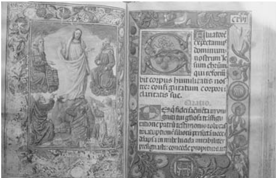
FIG. 4. Transfiguración del Señor, folio sin numerar entre los fols. 115 y 116. Diurnal del Monasterio de Guadalupe.