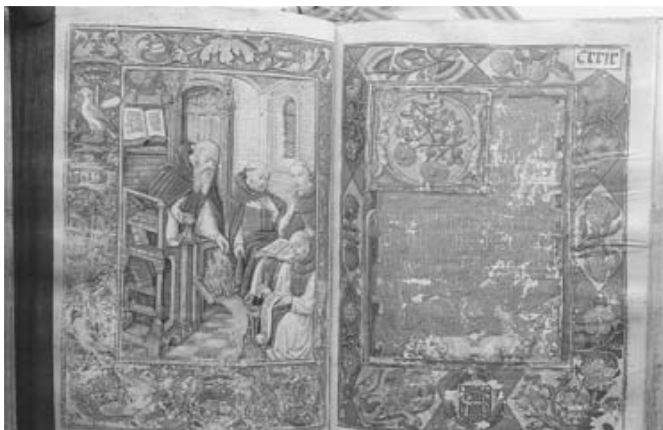
FIG. 10. San Jerónimo , en fol. sin numerar entre los 128 y 129.