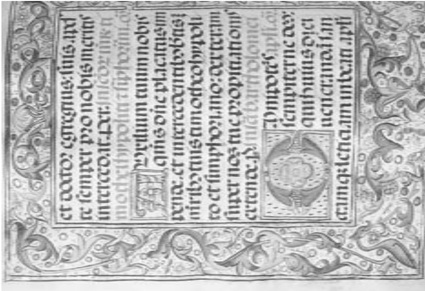
FIG. 6. Orla que señala la oración del Apóstol San Bartolomé, fol. 121 vto.