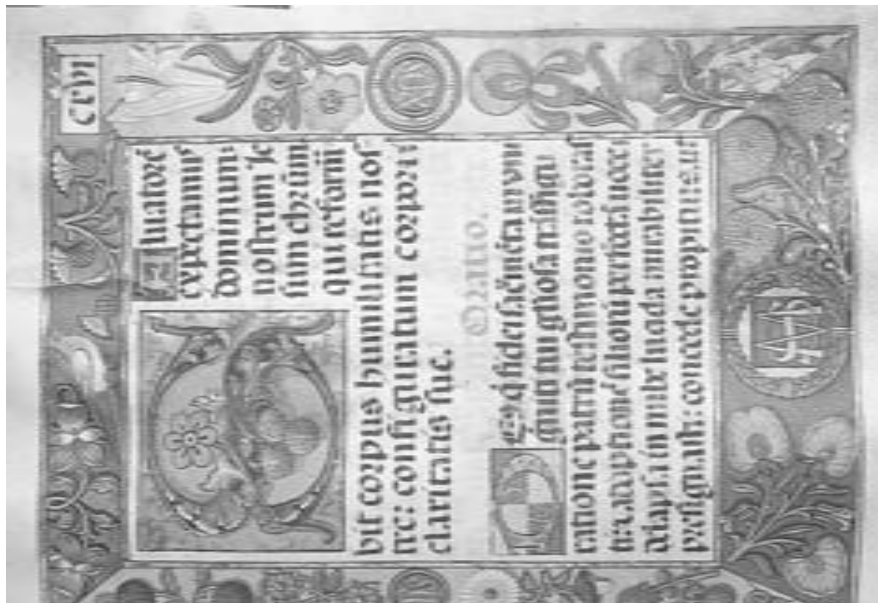
Fig. 8. Orla que acompaña y en la que se inicia las oraciones de la Transfiguración del Señor, fol. 116 recto.