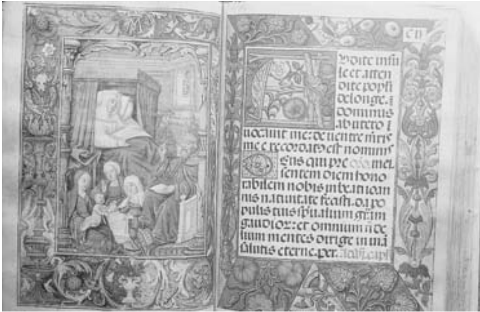
FIG. 3. Natividad de San Juan Bautista, fols. 101 vto. y 102 recto del Diurnal del Monasterio de Guadalupe.