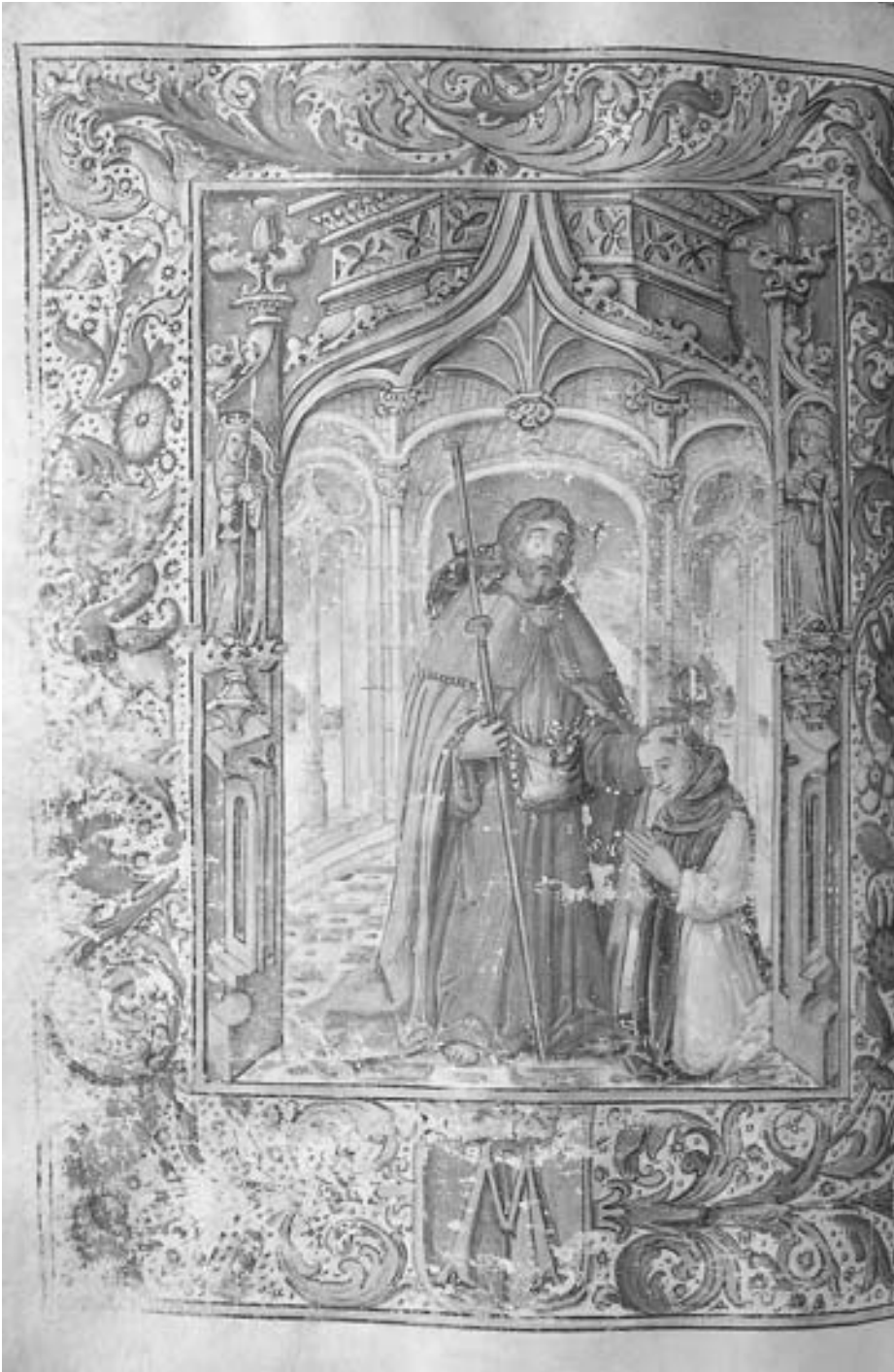
FIG. 11. Festividad de Santiago Apóstol. Santiago con fray Nuño de Arévalo.