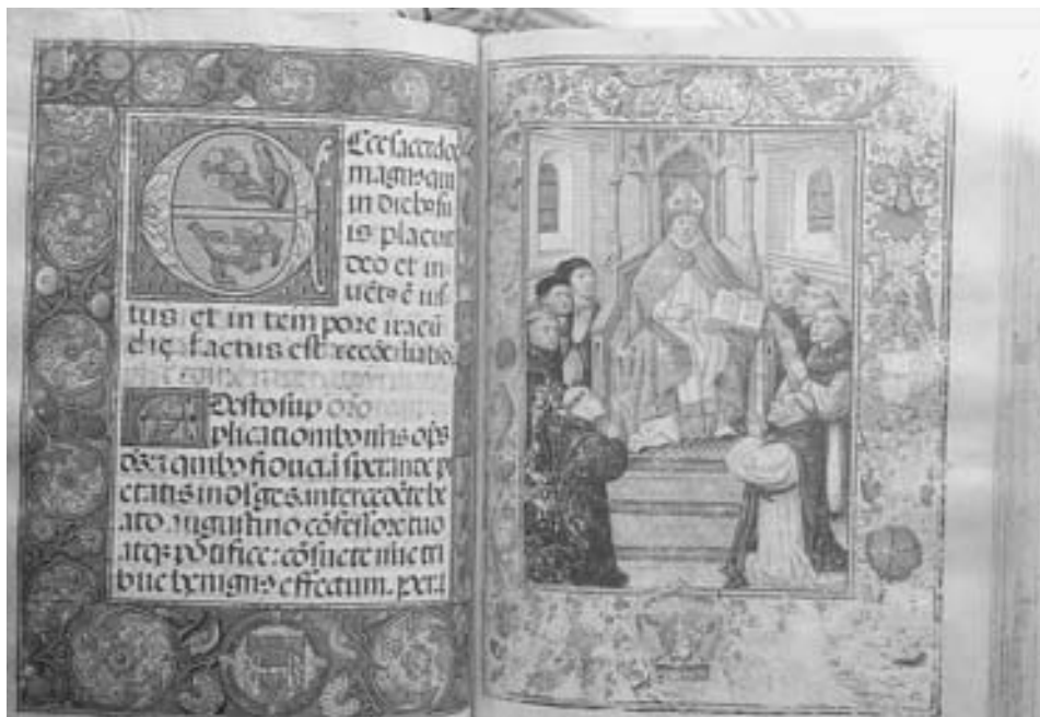
FIG. 9. San Agustín , fols. 121 vto. y 122 recto.