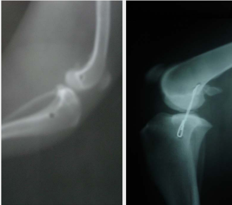
FIGURA 7. TÉCNICA HAMACA MODIFICADA. VISTA LATERAL