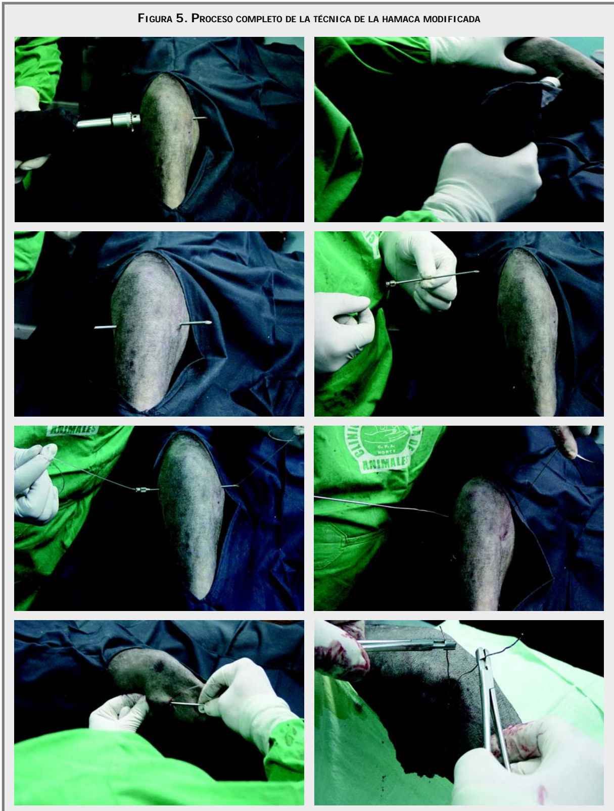
FIGURA 5. PROCESO COMPLETO DE LA TÉCNICA DE LA HAMACA MODIFICADA