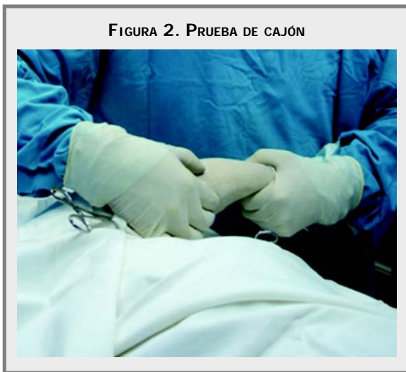
FIGURA 2. PRUEBA DE CAJÓN

laxitud de la articulación. Existen pruebas específicas para la lesión del ligamento cruzado anterior que son la prueba de cajón, prueba de compresión tibial y pruebas adicionales. Para realizar la prueba de cajón, el examinador se coloca detrás del paciente que se halla en posición decúbito lateral, se tiene que relajar o si es necesario debe dormirse al paciente; la extremidad a examinar tiene que estar en la parte superior, se estabiliza el fémur distal mediante la colocación del dedo medio en el cóndilo femoral medial y el dedo pulgar en el cóndilo femoral lateral; con la otra mano se asegura la tibia mediante la colocación del pulgar por detrás de la fibula proximal, el dedo índice en la cresta tibial y los dedos medio, anular y meñique en la tibia medial proximal; el fémur se mantiene inmóvil y se moviliza la tibia proximal en dirección anterior y posterior, esta maniobra se repite con la articulación en extensión, en posición vertical neutra (140° de flexión) y en flexión plena, el movimiento se examina con una evaluación de una rotación interna o externa de la tibia (Ver Figura 2). (Flo, 1993).