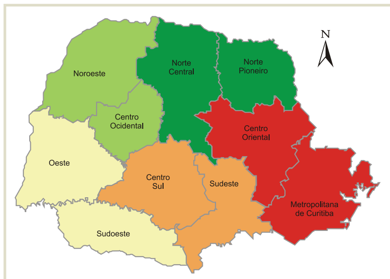
FIGURA 3 - AGRUPAMENTO DAS MESORREGIÕES PARA TESTES ECONOMÉTRICOS

De acordo com a metodologia do Instituto Brasileiro de Geografia e Estatística (IBGE, 2013), o Estado do Paraná é formado por dez mesorregiões, mas devido à fragilidade dos resultados econométricos obtidos originalmente, optou-se pelo agrupamento das mesorregiões, conforme se observa na figura 3. Tal agrupamento foi necessário para obter um melhor ajuste do modelo, uma vez que, com um maior número de observações obtêm-se parâmetros mais significativos, podendo-se assim entender melhor a variação da produção nas áreas agrupadas. O critério para estabelecer o agrupamento está na posição geográfica e proximidade entre mesorregiões, de modo que se preservem as especificidades locais. O mapa com as mesorregiões agrupadas está demonstrado na figura 3.