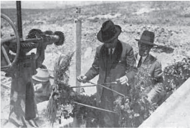
Mecanisme d'inici del sífó del Sió.

principal del Canal d'Urgell, punt fins on estaven acabades les obres. El mateix Sr. Maluquer, segons la crònica del diari Pla i Muntanya , en el discurs de l'hora de dinar, va dir que es reservava el brindis per al dia que realment estiguessin del tot finalitzades.