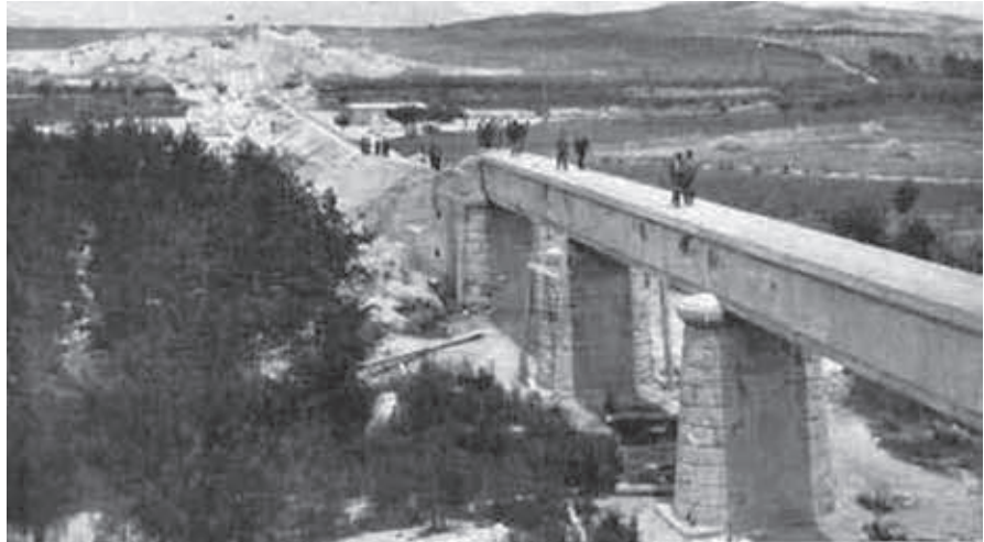
Aqüeducte del riu Sió.

Segons la documentació de la Sociedad Canal de Urgel S.A., cedida a l'AHCPU per ACUDAM, en el mes de desembre de 1933, l'enginyer encarregat de l'obra certificà que les obres del Canal Auxiliar havien començat el 4 de maig de 1929 amb la previsió d'acabar-les el 31 de març de 1934, i dels 11.832.985 pessetes que la Sociedad Canal de Urgel tenia pressupostats se'n portaven gastats 7.191.939, repartits entre obres per contracte