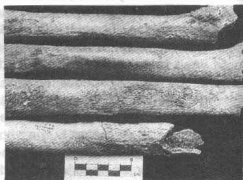
Foto 1/Huesos largos afectados por posible lesión treponematósica del sitio PK 187+500.

Representado por huesos largos muy fragmentados, sin epífisis (fémures, tibias y fíbulas), y piezas dentales. No tenía cráneo. Individuo adulto medio (aproximadamente 35 años), de sexo masculino a juzgar por el tamaño de los dientes. Fémur izquierdo (Foto No. 1). Sin epífisis. En el tercio inferior de la diáfisis, debajo del agujero nutricio observa reacción perióstica difusa, con ensanchamiento del hueso, estriado, hoyuelos y cavitaciones superficiales. Tibia izquierda. Manifiesta engrosamiento de la cortical, ligero esclerosamiento de la cavidad medular y reacción perióstica difusa desde la tuberosidad tibial hasta la epífisis distal. Se aprecian hoyuelos, estrías, placas de necrosamiento (Foto No. 2). La cara medial es la más afectada, también la lateral, y en menor medida la anterior. Fibula izquierda. Fragmento de aproximadamente 14 cm de longitud, con reacción perióstica y ensanchamiento en el tercio superior de la diáfisis. Fémur derecho. Por debajo del agujero nutricio presenta engrosamiento y reacción perióstica difusa que se