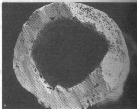
Foto 4/Engrosamiento anormal de la cortical.