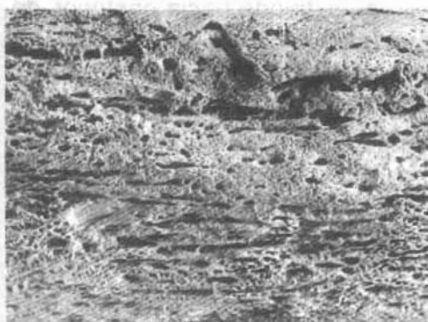
Foto 5/Estrias, hoyucos, placas de necrosamiento por reacción perióstica.

La reacción perióstica se extiende desde la terminación de la línea áspera hasta el tercio inferior. La cara medial se observa afectada aunque en menor intensidad. El labio medial de la línea áspera se aprecia muy marcado en su lugar de bifurcación.