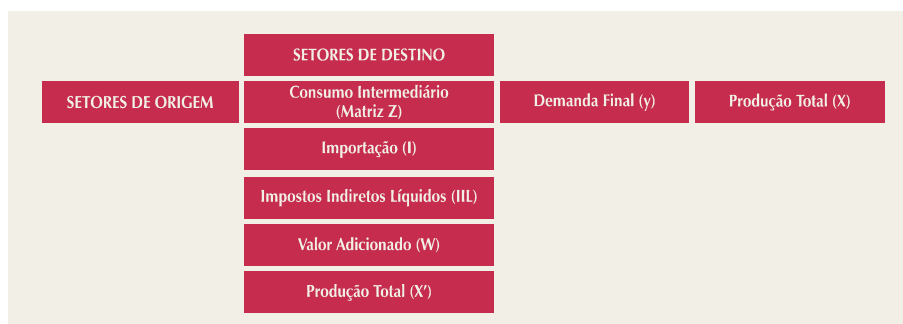
FIGURA 1 - RELAÇÕES FUNDAMENTAIS DE INSUMO-PRODUTO

Conforme mostra a figura 1, cada linha da matriz Z indica o fluxo intersetorial, ou seja, o consumo intermediário de bens e serviços de cada setor. A matriz Y registra o consumo final, dividido em consumo das famílias, consumo governamental, exportações, formação bruta de capital fixo e variação de estoques. As linhas abaixo das matrizes Z e Y registram as despesas com importações, impostos indiretos líquidos e o valor adicionado (remuneração aos serviços dos fatores de produção). Os totais das colunas e das linhas da matriz (vetor X e X' ) registram a produção total de cada setor e devem ser iguais, indicando o equilíbrio da economia no qual as despesas de cada setor são iguais às suas respectivas receitas.