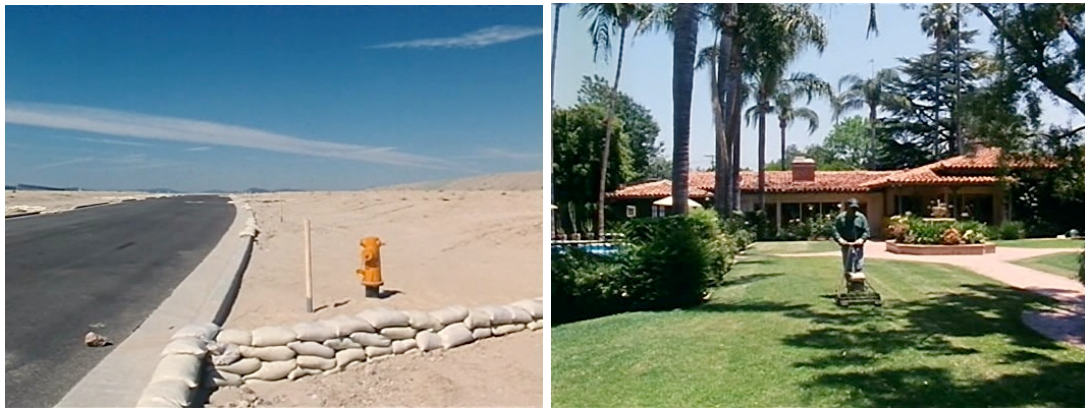
Imágenes 5 y 6: Los , parcelas urbanizables en Stevenson Ranch (izquierda) y una vivienda privada en Encino (derecha)

NOTA: El plano 34 no aparece en este cuadro porque muestra más bien la falta de vivienda en Skid Row