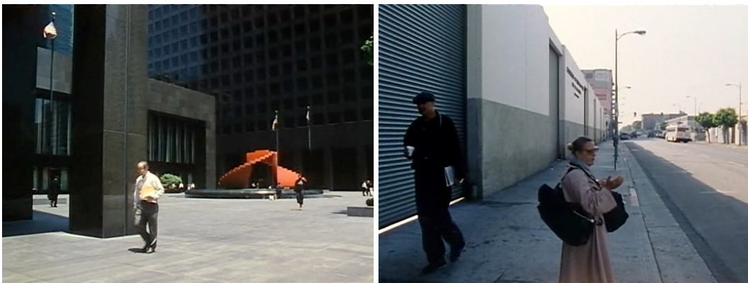
F 3 y 4: Los , Arco Plaza (izquierda) y Skid Row (derecha)

experiencia cotidiana de la ciudad para alguien, como Benning, que vive en sus suburbios septentrionales. Por este motivo, el Downtown aparece representado únicamente por sus dos extremos: el oeste, entre Figueroa y Olive Street, que es el territorio de los rascacielos y los hombres de negocios [planos 7º y 16º, F 3]; y el este, entre Main Street y el río Los Ángeles, que es en donde se encuentra la cárcel del condado y la mayor parte de indigentes de la región [planos 8º y 34º, F 4]. El punto de sutura entre estos dos mundos –el corredor Broadway-Spring– no aparece en la película, quizás para enfatizar la polarización espacial de la zona, que ha sido descrita por Soja en los siguientes términos: