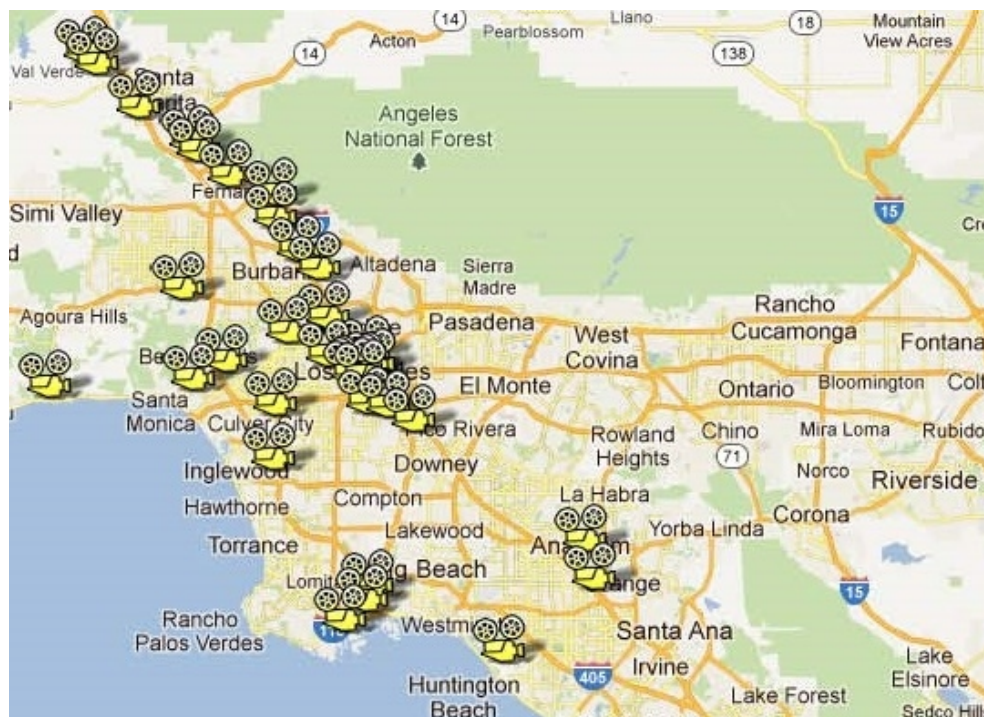
Mapa 1. Localizaciones de rodaje de Los . Mapa disponible en http://g.co/maps/ct97j

noroeste de Los Ángeles (en la esquina superior izquierda del mapa): ese es el lugar desde el que Benning percibe el territorio, ya sea el Gran Los Ángeles, el Central Valley o el estado de California en su conjunto. Desde allí, el cineasta está obligado a tomar la Interestate 5 –la autopista que vertebraba buena parte de la región urbana de Los Ángeles y la comunica con las principales ciudades de la costa oeste– para llegar a cualquier destino, en un movimiento perpetuo que documenta implícitamente la dependencia del automóvil que hay en las ciudades del Sun Belt. De ahí que muchas películas de Benning puedan considerarse también como diarios de viajes o incluso road movies .