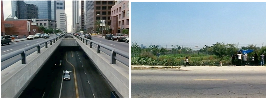
F 7 y 8: Los , Bunker Hill (izquierda) y South Central Community Garden (derecha)

futuro, como el South Central Community Garden [plano 31, F 8], que actualmente no es más que una parcela vacía de terreno. 5