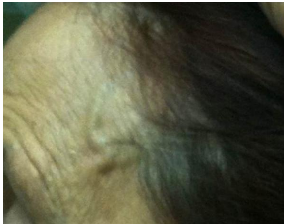
Figura 1. Engrosamiento de la rama frontal y parietal de la arteria temporal izquierda.

Mujer de 73 años edad que acude a consulta por cefalea frontal, pulsátil, bilateral, de predominio izquierdo y de un mes de evolución. En la exploración física se detectó: engrosamiento de las ramas frontales de las arterias temporales (más evidente en la izquierda) ( Figura 1 ), dolor a la palpación y la ausencia de los pulsos de las arterias temporales, mialgia y rigidez cervical, claudicación mandibular y paresia del músculo recto externo izquierdo. La determinación de la velocidad de sedimentación globular fue de 76 mm/h.