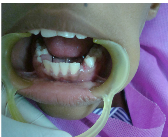
Figura.7. Aspecto clínico de postoperatorio 8 días.

Se encontró diseminación de la inflamación, se evidencia no solo un órgano dentario permanente si no un temporal que se mostró al tiempo que iba erupcionando el permanente.