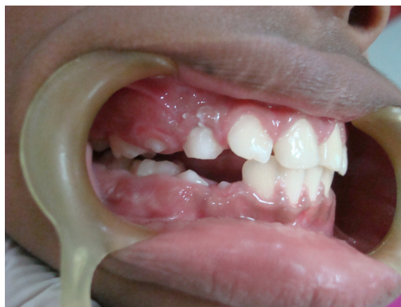
Figura 8. Aspecto clínico de postoperatorio 15 días.

Durante la inspección a los 15 días se halla mayor estructura dental erupcionada en vía correcta ya no existe sintomatología dolorosa ni hay tejido gingival inflamado alrededor (fig.8).