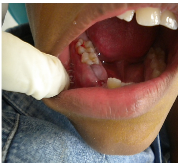
Figura 6. Aspecto clínico de postoperatorio inmediato.