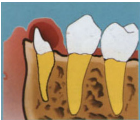
Figura 1. Quiste de erupción en zona de canino inferior sobre la cresta alveolar. J. Phillips. Libro de Patología Oral y Maxilofacial Contemporánea, 2 a Ed. 2004.

El quiste se desarrolla en el tejido blando que rodea la corona de un diente en erupción, se muestra como una masa blanda fluctuante sobre la cresta alveolar como se observa en la figura número 1 (1) .