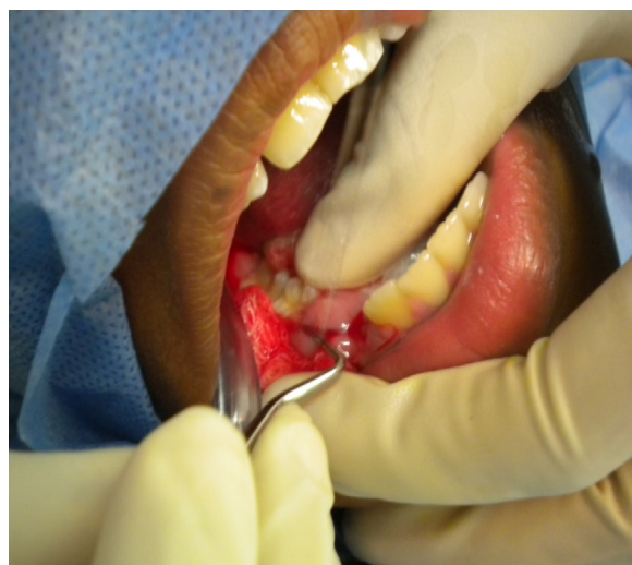
Figura 5. Exploración de la lesión con cureta de Lucas.