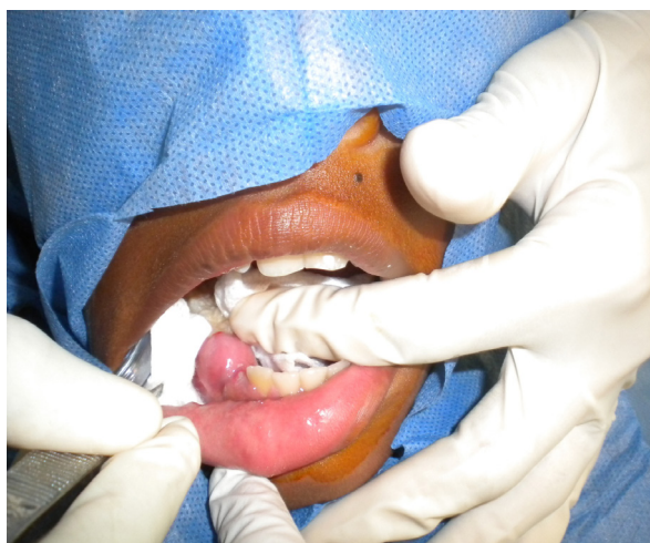
Figura 3. Aspecto intraoral de la lesión.

En la historia clínica del paciente fue establecido como diagnóstico: -Quiste de erupción a nivel de órganos dentarios 83 y 44.