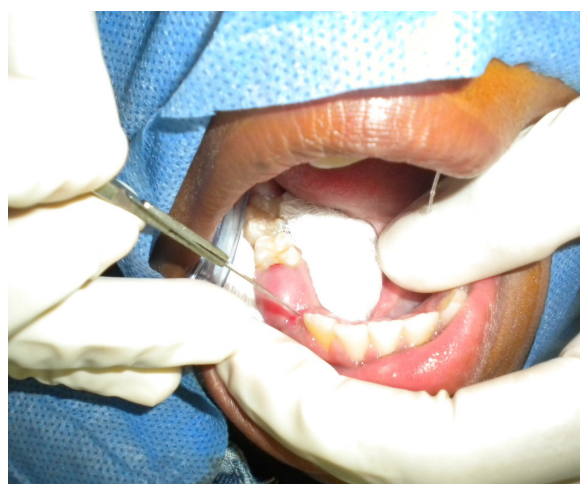
Figura 4. Aspecto clínico de incisión lineal sobre la lesión.

Se realizó asepsia del campo operatorio y antisepsia del paciente con yodopovidona, luego aislamiento relativo de la lesión con algodón y gasas, posterior a anestesia tópica. Incisión de tipo lineal sobre la lesión (fig. 4) para levantar un colgajo de espesor total, se explora y se realiza curetaje con cureta de lucas (fig. 5). Por último se reposiciona el colgajo de espesor total 5 .