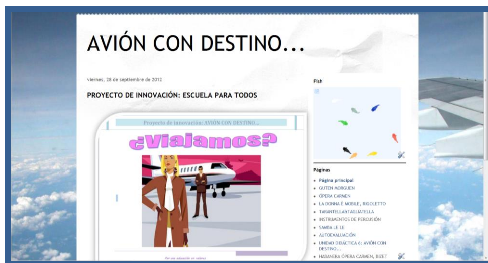
Fig. nº 1 Captura del edublog “Avión con destino...”

2.- Interpretación de la canción Guten Morguen (figura 2). Inicialmente se muestra la bandera alemana, británica, española e italiana y se lanza la pregunta ¿a qué países pertenecen estas banderas?, después se interpreta vocalmente la canción. Disponible para su consulta en la página del edublog titulada “Guten Morguen”.