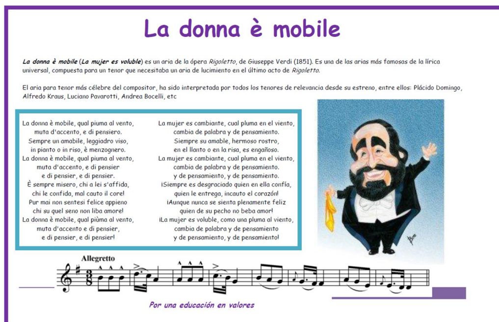
Fig. nº 3 Partitura “La donna é mobile”

7.- Interpretación con flauta dulce y canto del Aria de la ópera Rigoletto “La donna è mobile”. Traducimos la letra del italiano al español y reflexionamos sobre su contenido. Disponible para su consulta en la página del edublog titulada “La donna è mobile, Rigoletto”.