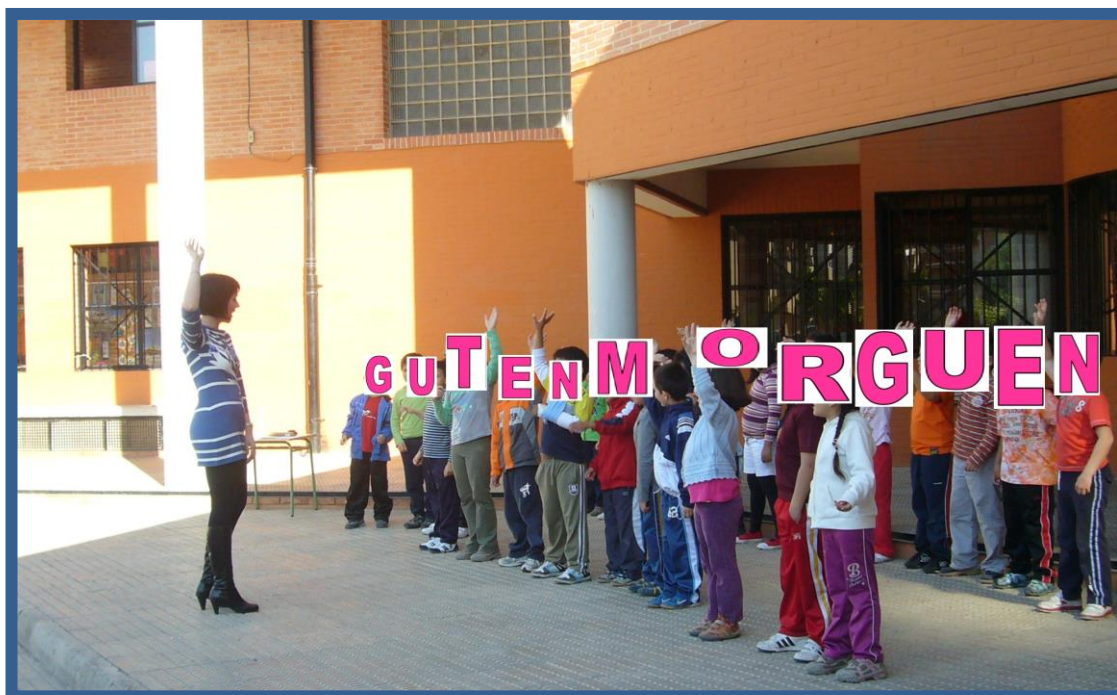
Fig. nº 4 Interpretación canción Guten Morguen en el patio del centro

13.- Interpretación (como broche final a la experiencia) de la canción Guten Morguen en el patio del colegio con el resto de cursos como público (figura 4).