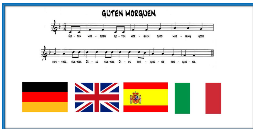
Fig. nº 2 Canción Guten Morguen

2.- Interpretación de la canción Guten Morguen (figura 2). Inicialmente se muestra la bandera alemana, británica, española e italiana y se lanza la pregunta ¿a qué países pertenecen estas banderas?, después se interpreta vocalmente la canción. Disponible para su consulta en la página del edublog titulada “Guten Morguen”.