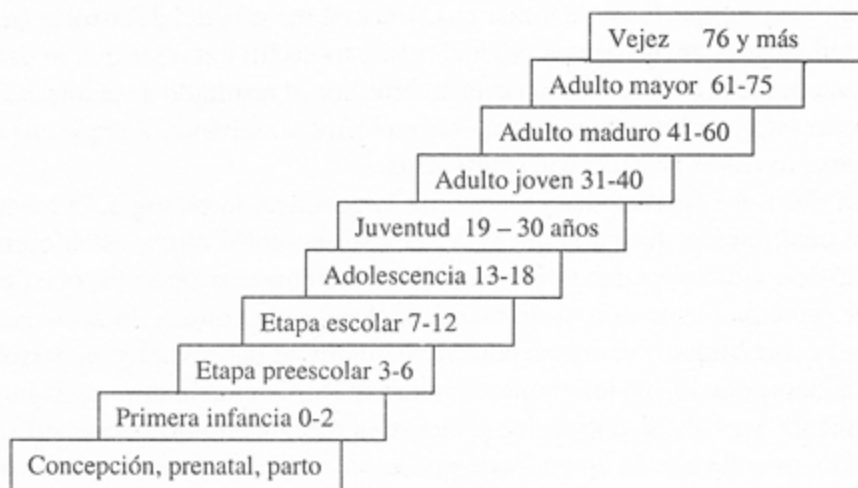
Gráfico 2 Principales etapas del desarrollo humano

Aunque no existe un consenso total sobre las etapas, al igual que es el caso de las áreas, pues se puede considerar formularlo a nivel de etapas globales, o a nivel de etapas y subetapas, para efectos de este trabajo y por su vinculación directa con los procesos educativos, se propone visualizar el desarrollo fundamentalmente en las siguientes etapas: