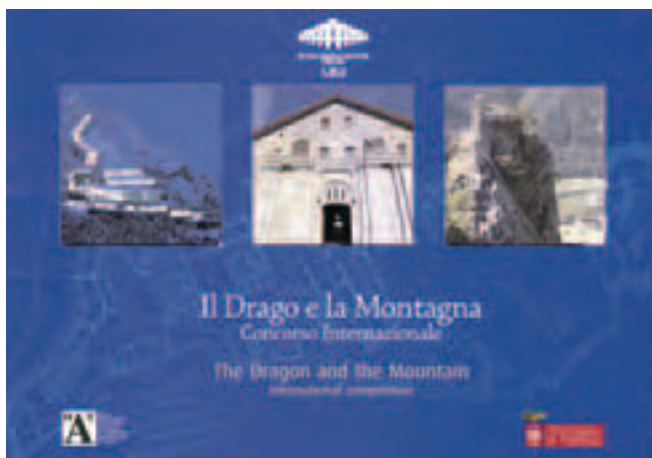
(Figura 3) Licitación pública internacional "El Dragón y la Montaña" para recuperar el complejo monumental de Fenestrelle.

total, ocupa una superficie de más de 1.300.000 metros cuadrados (figura 1).