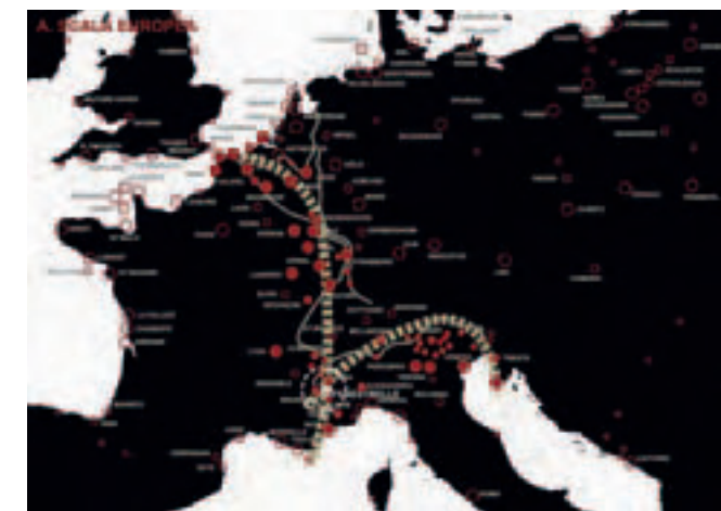
(Figura 4) La red de las fortalezas - de las Ardenas a los Alpes, del Atlántico al Mediterráneo

Para la Comunidad Europea estos testimonios históricos pueden representar elementos de relación e