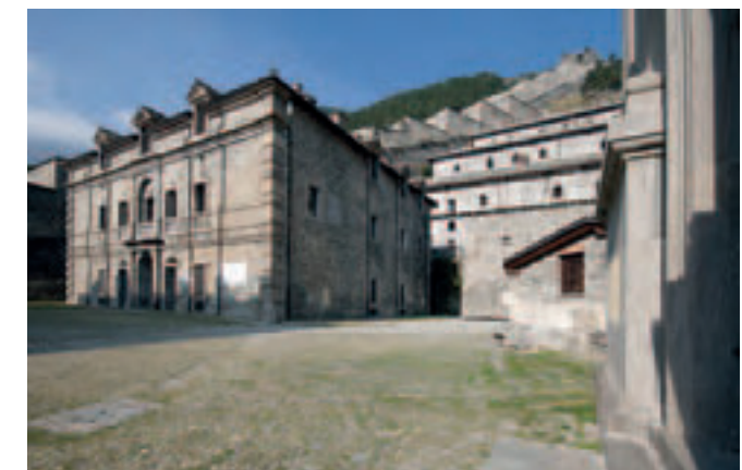
(Figura 8) Fortaleza de Fenestrelle (Piergiuseppe Manassero)

desarrollar una movilidad lenta para restablecer una justa relación con el tiempo y el espacio. Esta solución representará una opción más a las vías de comunicación rápidas puestas en la llanura (autopistas, AVE, etc.)