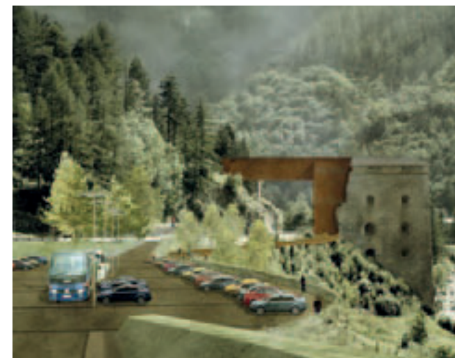
(Figura 9) Proyecto: aparcamiento y Ridotta Carlo Alberto.

En realidad la Ridotta representaba la barrera militar