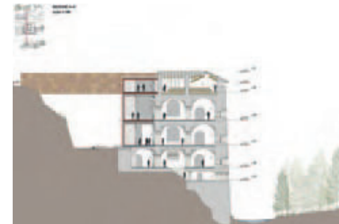
(Figura 10) Proyecto restauración Ridotta Carlo Alberto: sec-

Desde la parte antigua del edificio sale afuera el ‘cubo’, una realización simplificada que arregla la geometría histórica de la Ridotta y guarda la potencia de su