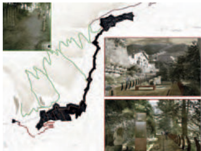
(Figura 5) La visita a través de tres caminos diferentes: El camino cubierto, camino de la Puerta Real, camino de los cañones.

–Movimiento ‘lento’. Para que el hombre reencuentre el placer del tiempo libre y del bienestar habrá que recuperar las antiguas calles (los caminos militares) y