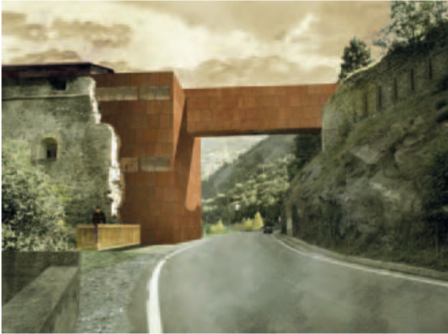
(Figura 12) Proyecto restauración Ridotta Carlo Alberto: representación de la vista del valle.

fuerte de San Carlo. Otra opción es ir paseando por el camino de la Puerta Real. Esa ruta pasa por un palomar y llega a la misma Puerta a través de un antiguo túnel. El recorrido tiene un valor histórico muy grande y regala al visitante muchísimas emociones. En efecto, esa calle permite conocer y experimentar muchos aspectos ambientales (como la profundidad del valle hacia Turín o los efectos sugestivos de la construcción arquitectónica sobre las rocas) e históricos (la construcción de la Puerta como consecuencia de la conquista de estos lugares por el Piemonte). Todo el camino está protegido por módulos de acero corten y madera de alerce con la iluminación a lado de la superficie del recorrido.