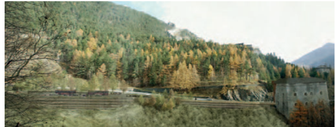
(Figura 6) Proyecto: aparcamiento y Ridotta Carlo Alberto.