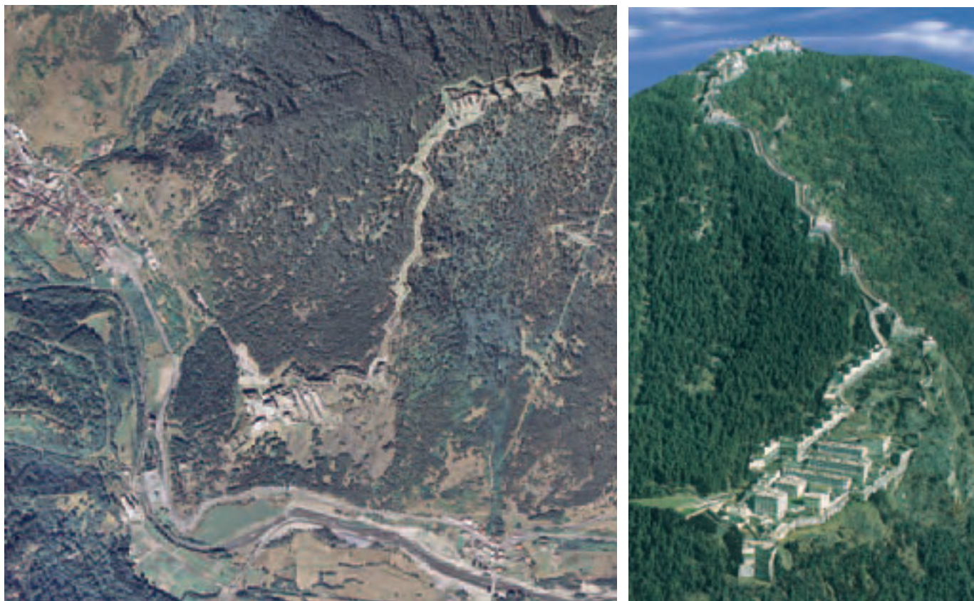
(Figura 1) Vista aérea del valle Chisone y la fortaleza de Fenestrelle. (Figura 2) Vista de la fortaleza de Fenestrelle (Piergiuseppe Manassero).