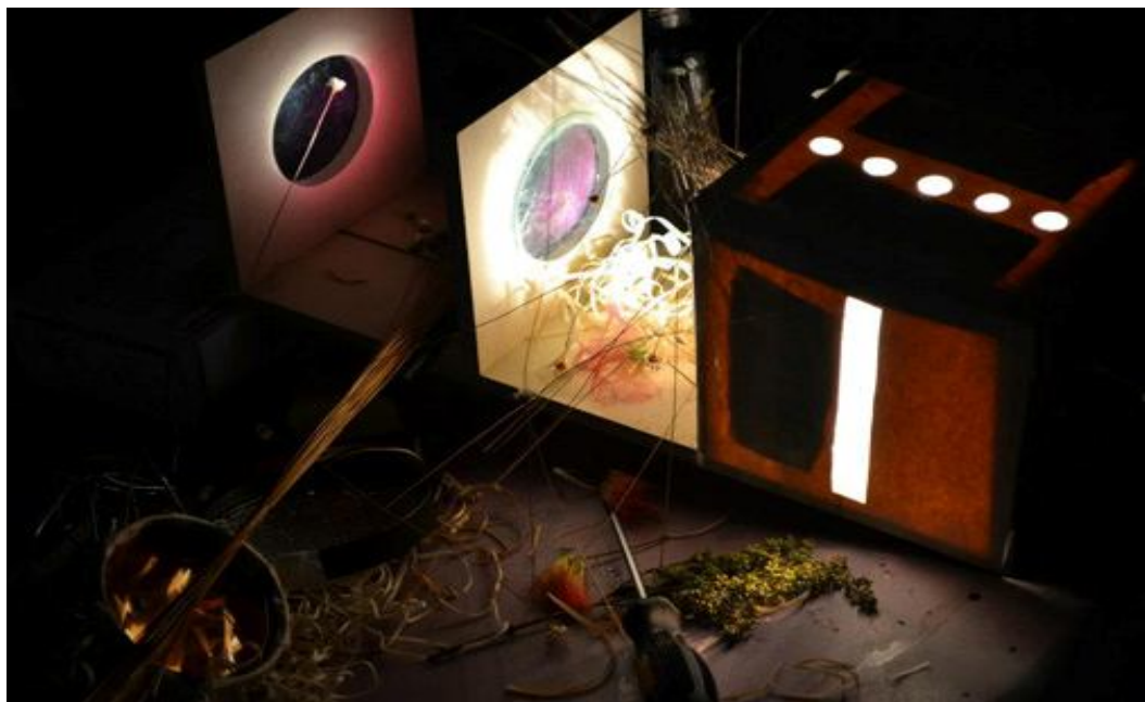
Proyector precario construido en una edición del TAPP.