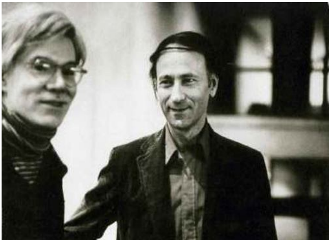
Andy Wahol y Jonas Mekas

¿Existe un común denominador que pueda casar dos posiciones aparentemente antagónicas respecto al cine? ¿Qué insólito hilo conductor podría ligar a un inmigrante lituano que trabajaba en fábricas para comprar un rollo de película por semana, con un publicista hijo de la clase media que será recordado como una de las figuras emblemáticas del arte del siglo XX? Por curioso que parezca, estos dos realizadores supieron reconocer tempranamente que las artes audiovisuales (tanto las que se vinculaban con el mercado del arte como las que se ligaban a la industria cinematográfica) se asentaban sobre los mismos pilares: publicidad, ventas, estrellas, mercado, negocios. Y ambos también —cada uno a su experimental manera, por supuesto— eligieron las sendas que les permitieron producir, financiar y exhibir sus trabajos de manera autónoma, es decir, autovalidando sus obras por fuera