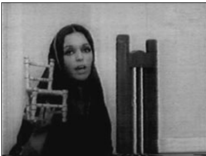
The Players versus Ángeles Caídos (Alberto Fischerman, 1969)

Estos cineastas estaban dispuestos a indagar, estudiar y trabajar con el celuloide de una manera personal y sin ningún tipo de condicionamientos económicos, estéticos, ideológicos o políticos. Mientras que el grupo de cine experimental exploraba nuevas formas de acercarse al dispositivo cinematográfico en una tradición que podríamos llamar “internacionalista”, las producciones de cine contestatario estaban ancladas a su tiempo y espacio: a la Argentina convulsionada, radical, sangrienta y revolucionaria de fines de los años 70.