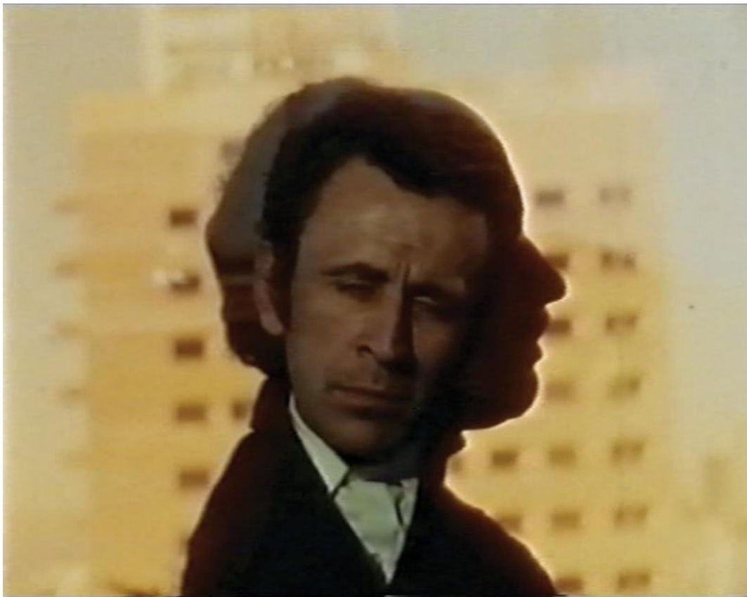
Puntos suspensivos (Edgardo Cozarinsky, 1970)