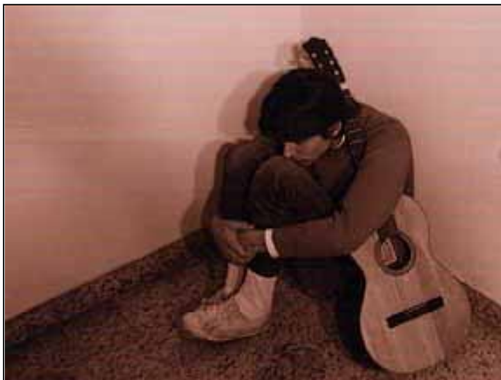
Campos bañados de azul (Silvestre Byron, 1971)

que se había apoyado la representación cinematográfica entendida en un sentido narrativo”. En este sentido, el cine experimental retomaba como eje de sus producciones aquello que para el cine narrativo era su condición de posibilidad: el tiempo y el movimiento.