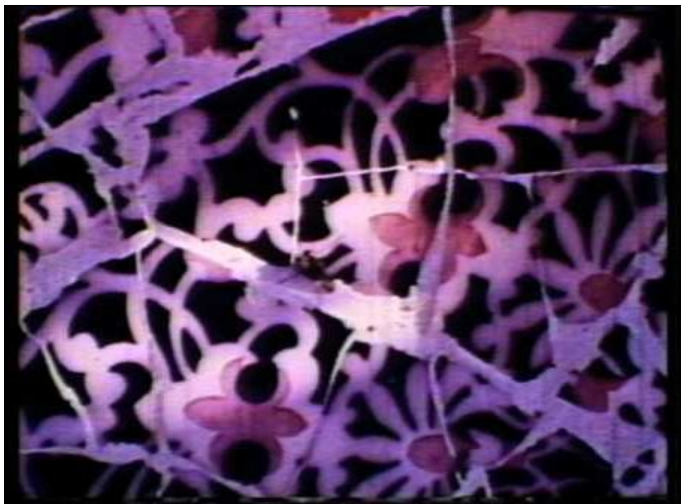
Film Gaudí (Claudio Caldini, 1975)