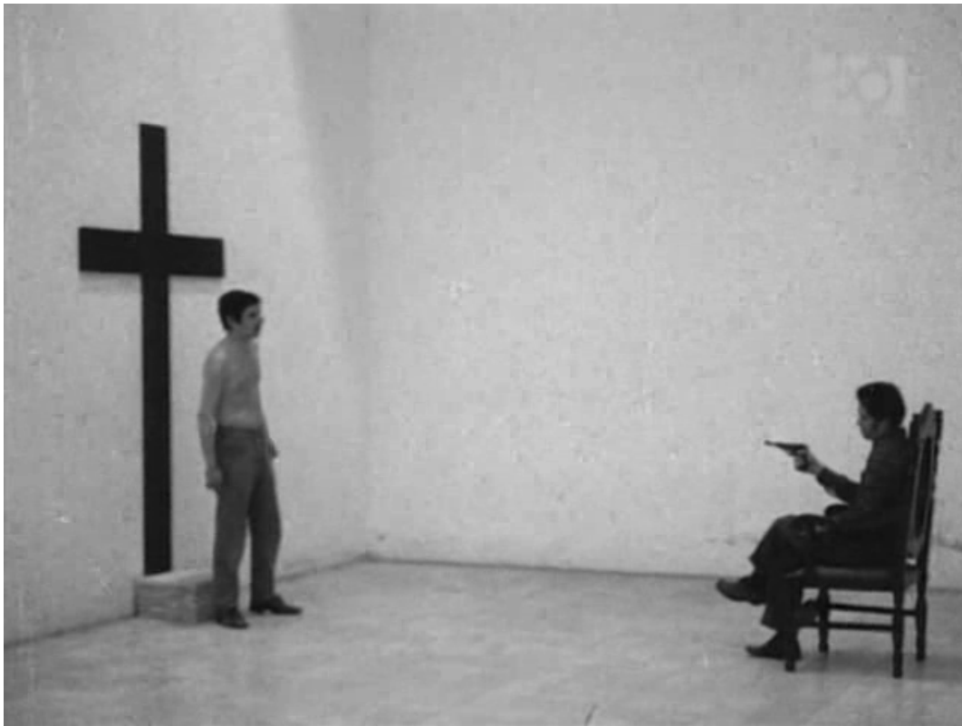
Alianza para el progreso (Julio César Ludueña, 1971)

(el empresariado, la Iglesia, el Ejército) con el apoyo y la complicidad de los sectores medios y de los gobiernos extranjeros (más precisamente Estados Unidos). La civilización está haciendo masa y no deja oír se dedica a mostrar el plan de una serie de prostitutas que, hartas de ser explotadas, deciden rebelarse en contra de sus proxenetas para ser libres. Beto Nervio contra el poder de las tinieblas , cuenta las aventuras de un héroe de historietas argentino que se ve envuelto en el misterioso asesinato de un dirigente sindical.