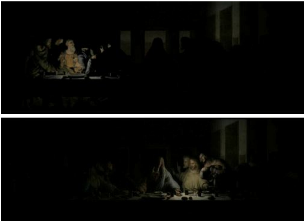
Figura 3: Fragmentos da projeção da instalação The last supper (Peter Greenaway, 2010).

Teria Leonardo da Vinci utilizado tal material propositalmente para que sua obra “desbotasse” rapidamente e revelasse segredos? Cristo já não é mais o centro da atenção; como observamos anteriormente, a mesa e o cenário ao fundo se sobressaem. E quando somos chamados a dar atenção aos corpos, uma assimetria é construída. Com luz e sombra, Greenaway transpõe o eixo central e ponto de fuga para a esquerda, para a direita, para cima ou para baixo; sai do coração de Cristo e vai para Pedro, para Tiago Maior, para Tiago Menor e Tadeu, compondo grupos de três dos apóstolos, colocando-os como centro da pintura –a tradição renascentista era colocar Cristo no centro da pintura. O que seria A última ceia sem Jesus? E, assim como Leonardo, Greenaway também mostra que muitas coisas aconteceram naquela noite; que há muita história além do próprio Messias.