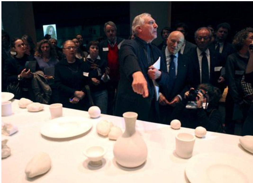
Figura 4: Montagem da instalação The last supper (Peter Greenaway, 2010).

Então Peter Greenaway projeta uma janela, ou melhor, a sombra de uma janela sobre A última ceia . Uma janela que transmite uma sensação de que há alguém observando (nós, espectadores) esta ceia. Ao mesmo tempo em que a pintura deixa um lado da mesa vazio, o lado em que nós nos postamos para compartilhar do “corpo e sangue de Cristo”, com a silhueta da janela, temos também a sensação de que não fomos convidados. Estamos dentro de onde a ceia acontece ou do lado de fora? E Greenaway reforça esta oposição dentro-fora, colocando a mesa da pintura no cenário de sua instalação.