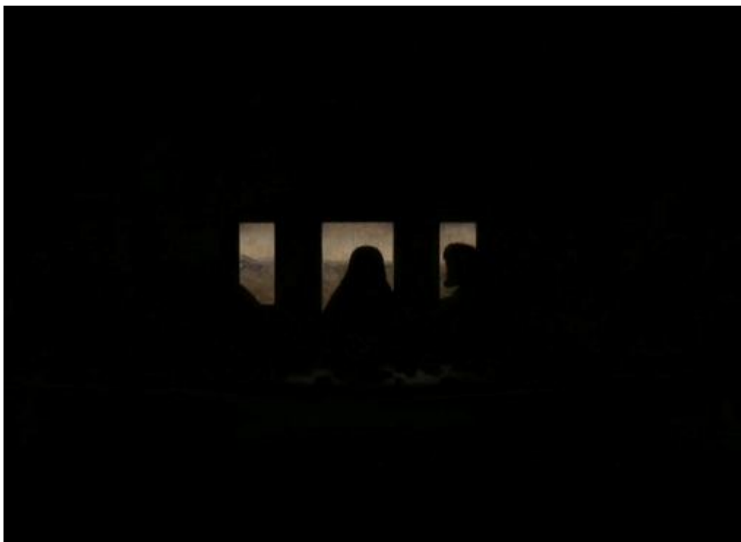
Figura 1: Fragmento da projeção da instalação The last supper (Peter Greenaway, 2010).

Transgressões que transpassam a luz modular esculpindo sensações que ampliam a estática do quadro, da pintura, construindo um diálogo entre a tinta, as fissuras corrosivas descascadas pela degradação temporal, o pintor (ou pintores), as personagens e objetos cênicos, a geometria espacial (dentro e fora do limite da tela), o barroco e o contemporâneo. Representações de uma percepção que Peter Greenaway repinta (e reescreve) por detrás das camadas de A última ceia de Leonardo Da Vinci.