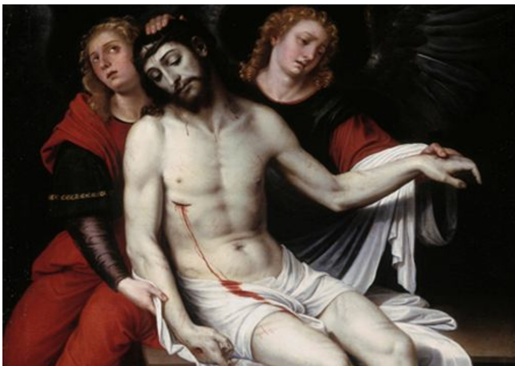
Figura 2: (detalhe) Cristo Morto sustentado por Anjos - Francisco Ribalta, 1615. Museu do Prado, Madrid, Espanha.

Porque o sangue de Cristo é tão importante? Talvez esta cor nos remeta a uma adoração e ao mesmo tempo a uma melancolia profunda; talvez deixemos de pensar Cristo como deveria ser pensado. Atribuímos a Jesus um status tão sagrado que seu corpo e sangue são únicos, sua imagem se torna o centro da atenção e (exceto pela anunciação e por Pietà), sua imagem rouba até mesmo a centralização de Maria. Jesus está exatamente ao centro da cena, o ponto de fuga da pintura está em seu coração. E nos passa despercebido que Leonardo tenha colocado sua cabeça reclinada mostrando sua face deprimida. Podemos ressaltar outros artistas que tenham também buscado o homem por trás do mito, assim como Greenaway nos mostrou. Ao tirar a luz de Cristo, ele é apenas Jesus de Nazaré, um carpinteiro por herança. Greenaway faz um jogo de luz que ressalta essa inclinação. Com a iluminação barroca ele destaca a face de Cristo. E reforça a tinta desbotada, a pintura descascada, o Messias que há por trás do azul ultramar e o vermelhon que o recobre.