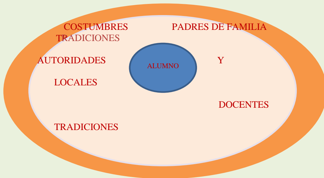
Figura 1.- Elaboración propia.

estructurando tanto su corporeidad como su personalidad en coherencia con los dictámenes de la cultura local.