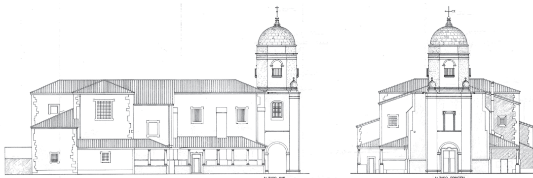
Fig. 5 Alzado sur y alzado principal de la actual iglesia de Santa María de Sábada

dos relicarios de oro y perlas con efigies del Ecce Homo y de la Soledad, un cáliz de plata con su patena sobredorada y veintidós cajas esmaltadas, de igual material 40 . Este primer envío será solo el anticipo de lo que nos encontraremos posteriormente ya que el goteo de piezas es constante. Es de destacar, sin embargo, las partidas más significativas que se realizan entre los años 1791 y 1792.