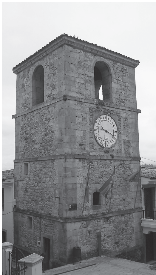
Fig. 2 Torre del Reloj, 1751- 1752

teriormente con casi toda seguridad a la función de atalaya por el gremio de mareantes, pudo ser levantada sobre una construcción anterior ya que se han querido ver vestigios del siglo xv en una ventana lateral, rematada en arco conopial y de pequeñas dimensiones. De sección cuadrada y cubierta a cuatro aguas recubierta con teja, sobresale del resto del caserío. Consta de cuatro pisos delimitados en los paños exteriores mediante líneas de imposta lisas. La fábrica, de muros de sillarejo y sillar de piedra arenisca en las cadenas esquineras, se abre en el cuarto piso mediante arcos de medio punto que dejan ver las campanas.