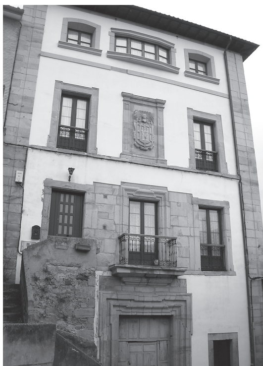
Fig. 4 Palacio de la familia Robledo, ss. XVII-XVIIIexplosión.