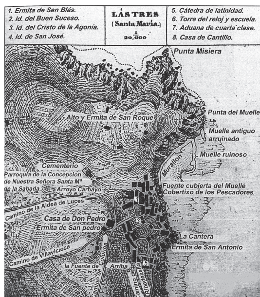
Fig. 1 Mapa de 1870 empleado por Madoz. MARTÍNEZ GARCÍA, Faustino (coord.), Lastres. Pueblo ejemplar de Asturias 2010 , Granda-Siero, 2010, p. 89.

cargo relacionado con el movimiento de la sal, que suponía contrataciones de barcos a nivel internacional.