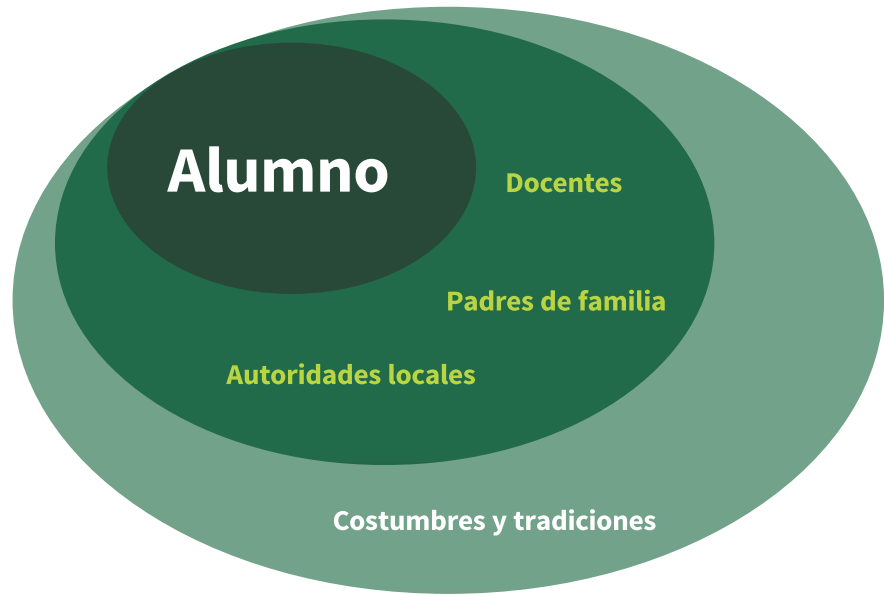
1. ELABORACIÓN PROPIA

De esta forma, las cuatro categorías resultantes de la aplicación de la técnica “ojos limpios” y la estrategia “6-3-5” resaltan que en un contexto tan empapado de creencias religiosas que involucran la devoción manifestada en fiestas del pueblo, siendo la posible solución, las subcategorías, si se aplican como un proceso para generar un cambio. Véase dibujo 2.