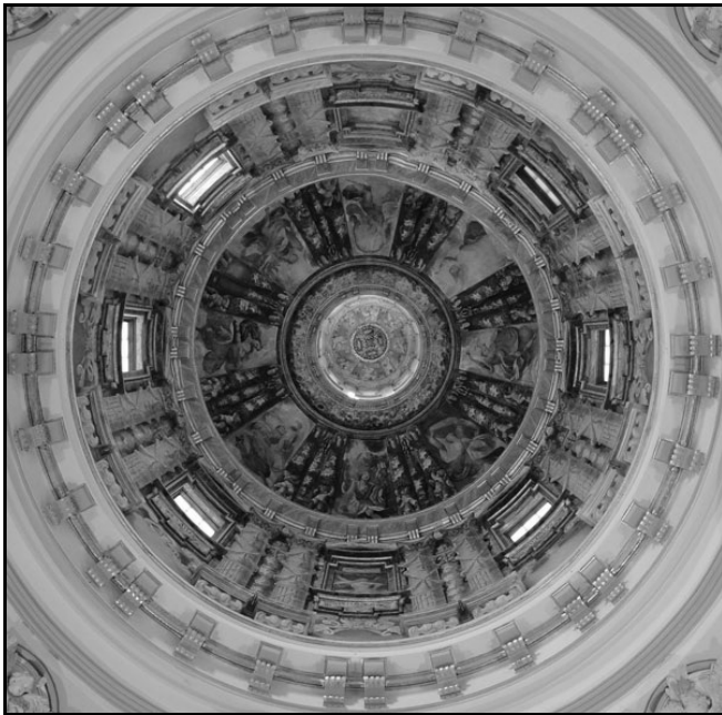
2. Cúpula de la capilla.