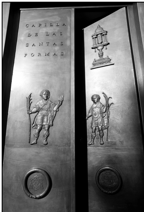
6. Nueva puerta de bronce de acceso a la Capilla de las Santas formas. (Foto Baldo).