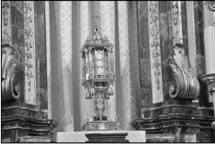
5. Detalle de la custodia tal como se ofrece a la adoración de los fieles.