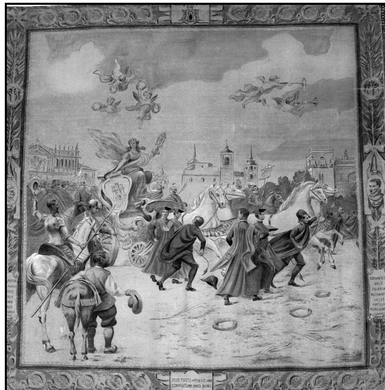
4. Tapiz pintado por Félix Yuste. Representa a la Villa de Alcalá con alegorías alusivas.