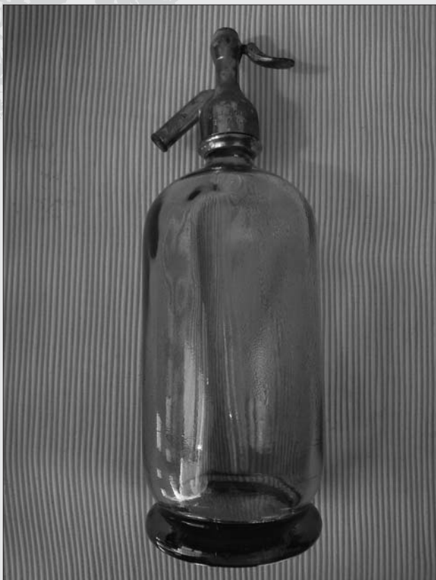
SIFÓN ORIGINAL DE JOSÉ GONZÁLEZ PÉREZ