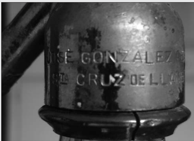
DETALLES DEL SIFÓN.