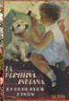
El chocolate un indiano en Asturias