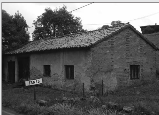
LA GASEOSERA EN SEPTIEMBRE DE 2013.