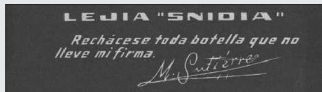
LITOGRAFÍA VIÑA. MUSEO DEL PUEBLU DE ASTURIÉS-GIJÓN

El proceso de fabricación de esta lejía era muy simple; en un depósito con agua se añadían “polvos blancos que quemaban” recibidos en saco, tarea que realizaba el propio Pepe por razones de seguridad. La lejía se envasaba en botellas de vidrio de 1 litro de capacidad que se corchaban con corcho del tipo de los usados para la sidra y se empaquetaban también en cajas de madera de 12 unidades.