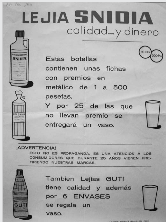
PUBLICIDAD DE SNIDIA . LITOGRAFÍA VIÑA. BIBLIOTECA DE ASTURIAS RAMÓN PÉREZ DE AYALA