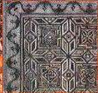
Trabajos en la villa de Andayón