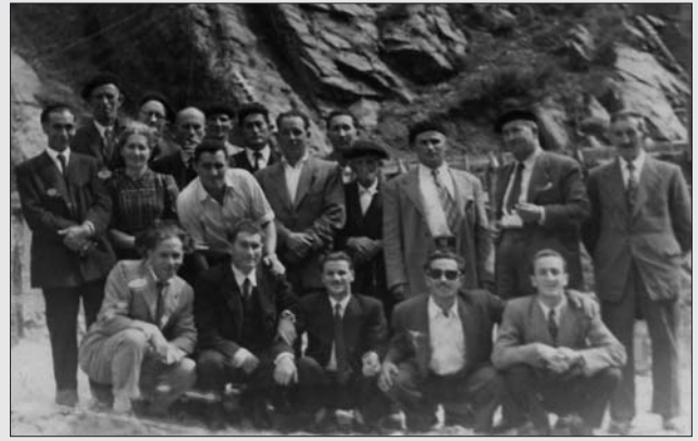
EXCURSIÓN A GRANDAS DE SALIME, 1953