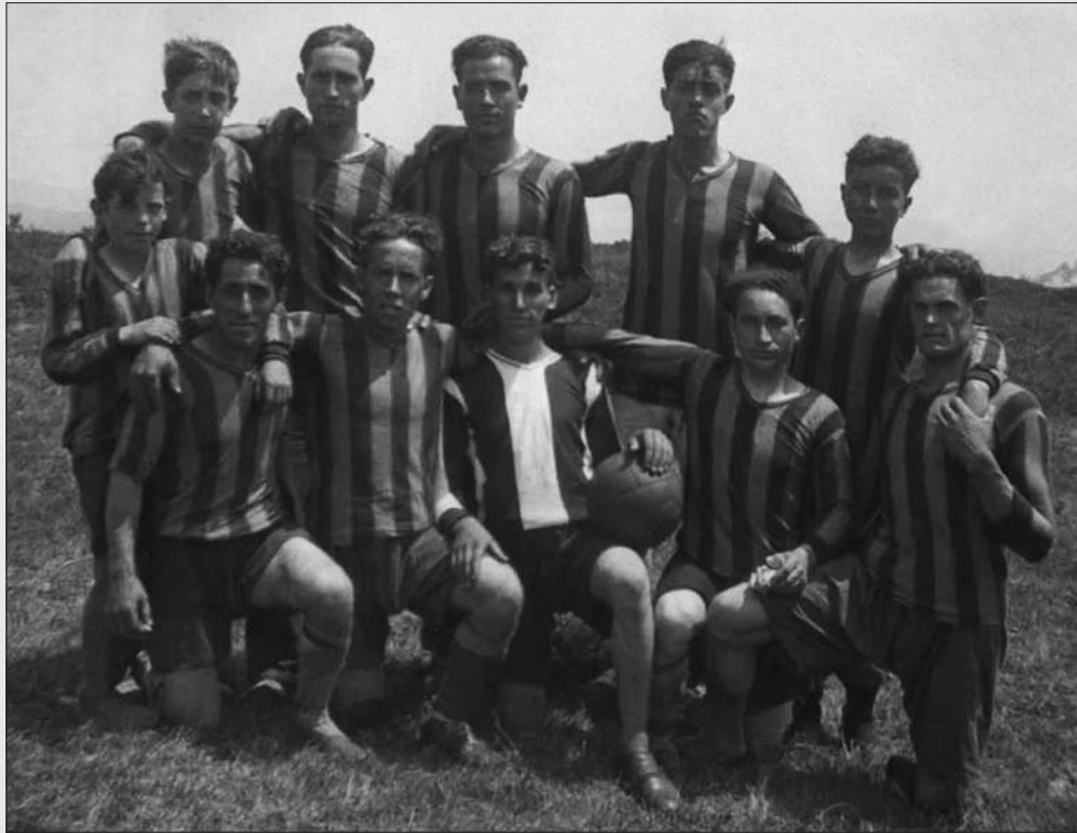
EQUIPO DE FÚTBOL DE SANTA CRUZ (1935?)

herencias. Cuando empezó la motorización se dedicó a hacer seguros en las parroquias de Santa Cruz, Arlós y en Las Regueras. Después, en Oviedo, además de los seguros, vendía libros. Todo eso después de salir de clase y los domingos. En 1953 se dedicó a la construcción y llegó a edificar dos edificios en Pumarín en Oviedo. Era lo que se dice hoy un manitas , sobre todo en la carpintería. Murió en agosto de 1999.