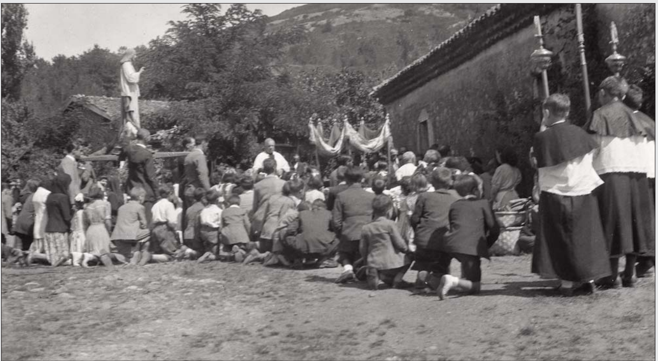
SANTA CRUZ, FIESTA SACRAMENTAL Y DEL SAGRADO CORAZÓN. SE VEN A LA DERECHA LOS CESTOS DE LES AVELLANERES.