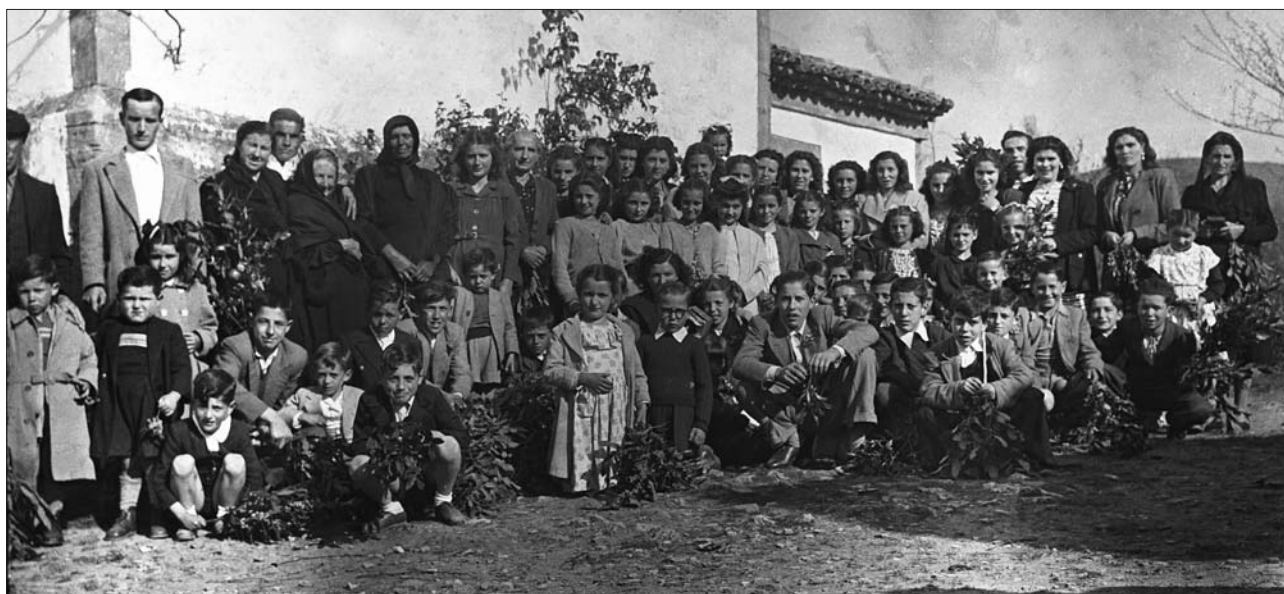
DÍA DE RAMOS EN SANTA CRUZ DE LLANERA A FINALES DE LOS AÑOS 40 DEL SIGLO XX

Desde el 1-1-1944 hasta final del curso 1945/1946 ejerce de maestro en la escuela de Santa