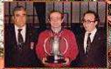
Regueranos en el hockey