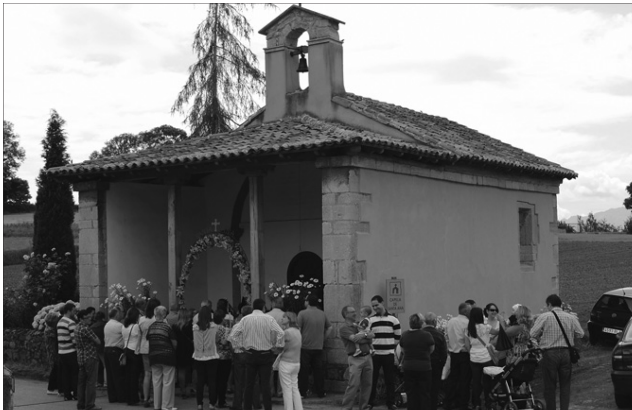
CAPILLA DE SANTA ANA EL DÍA DE LA FIESTA, 2012.

LUJª SEMEYES. WWW.LUCESFOTOGRAFIA.COM 696315189 / LUJOSEMEYES@GMAIL.COM