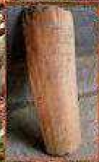
La tejera de Villayo