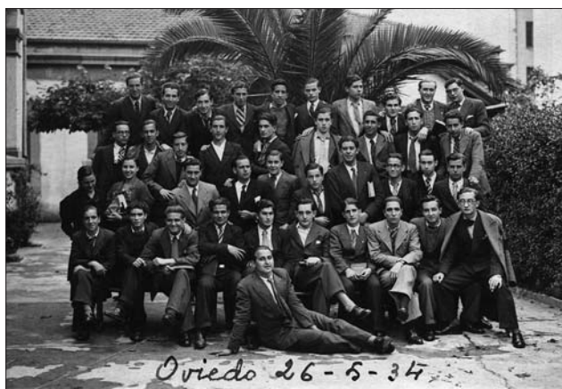
GRADUACIÓN DE 1934