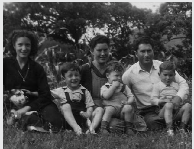
VILLAYO HACIA 1950...