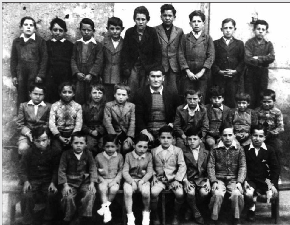
ALUMNOS ESCUELA DE SANTA CRUZ, 1945