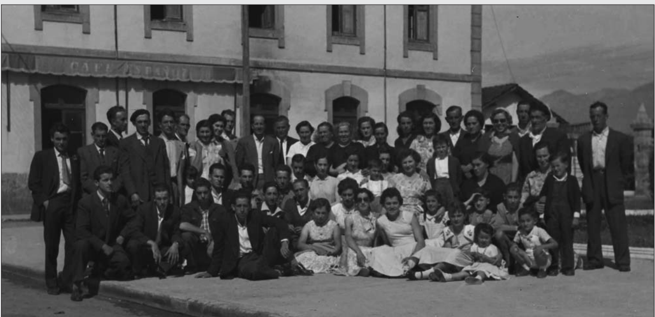
EXCURSIÓN A COVADONGA, PARADA EN CANGAS DE ONÍS, 1953. SUS FOTOS SON UN BUEN TESTIMONIO DE LA ÉPOCA. TODOS VESTIDOS CON LAS MEJORES ROPAS, MÁS HOMBRES QUE MUJERES...