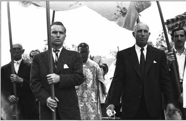
PROCESIÓN EN SANTA CRUZ HACIA 1950