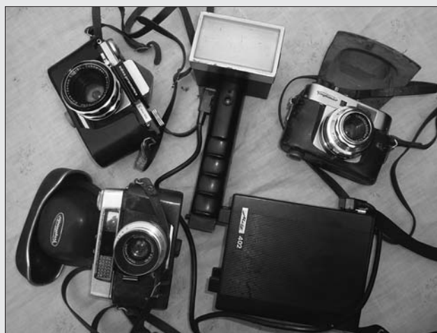
EL EQUIPO COMPLETO DE JOSÉ MARÍA, EN LA ACTUALIDAD.

Las cámaras registraron las imágenes, la calidad de la foto es una cuestión de habilidad y técnica, pero está claro que el ojo del fotógrafo fue el elemento imprescindible y excepcional para saber ver el entorno que enfocaba, exprimirle el jugo a lo retratado y, sin poses o alteración de la espontaneidad intrínseca de los grupos y escenas, levantar un acta notarial gráfica monumental, radicalmente perfecta. Todo ello fruto de las habilidades de un hombre de pueblo, con instrucción básica, de una formación técnica autodidacta que muestra una personalidad perfeccionista, y cuyos orígenes y vivencias personales le permitían acercarse a su entorno con gran familiaridad y así poder captar casi los sentimientos de lo que retrataba.