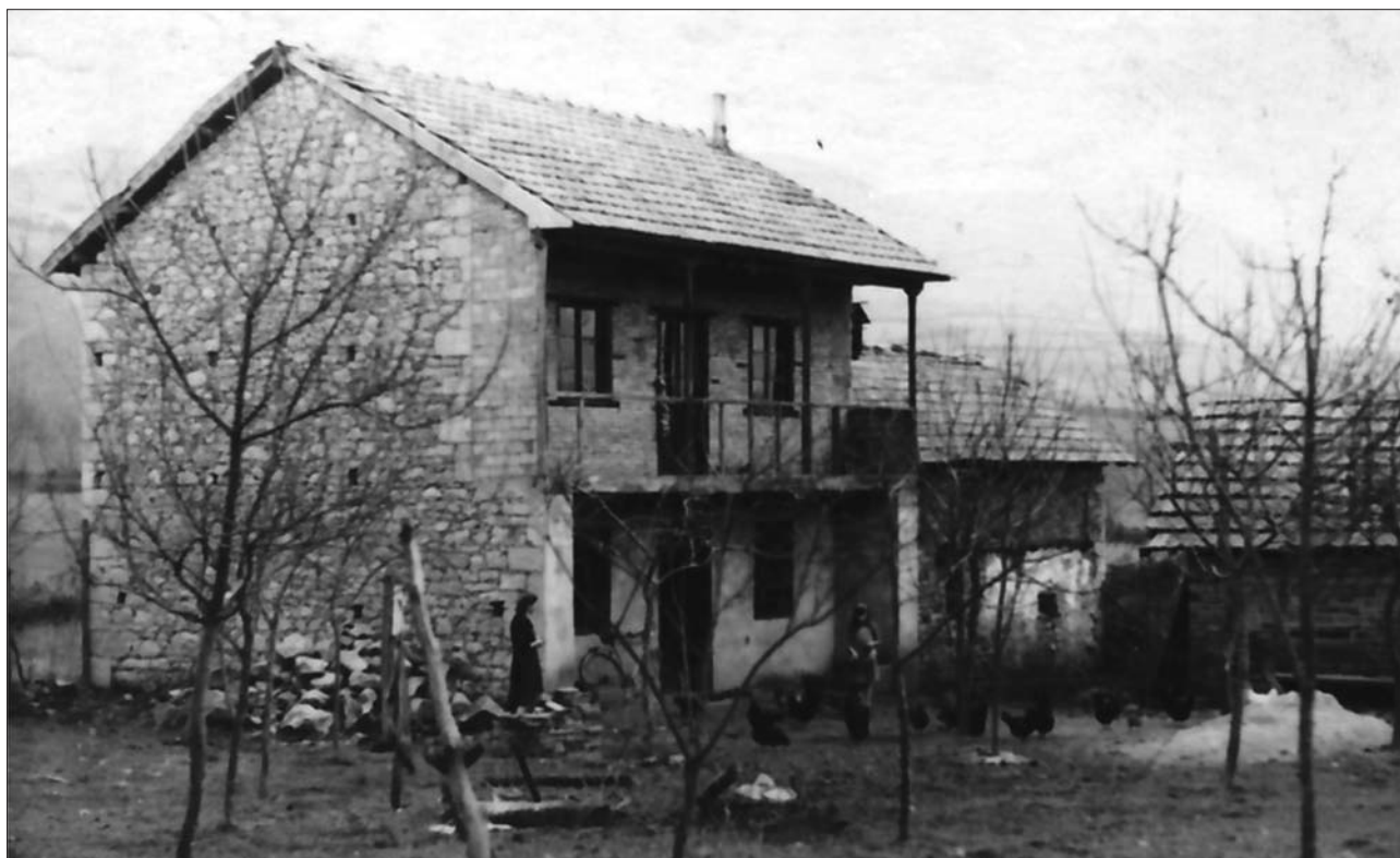
LA FOTO DE LA CASA DEL TEÑU, ENERO DE 1958, ESTÁ HECHA POR JOSÉ MARÍA EN LOS LABORATORIOS ASTRA DE OVIEDO, CASA CUYA TIPOLOGÍA SE CONSERVÓ EN LAS POSTERIORES REPARACIONES O MEJORAS Y QUE AÚN SE MANTIENE EN LA ACTUALIDAD, PERO ALTERADA POR LOS MODERNOS MATERIALES UTILIZADOS

Marcelino, el único de los hermanos vivos de nuestro protagonista, recuerda que la casa del Teñu era de planta baja, con portal, toda de piedra vista, incluso la cuadra que tenía adosada en la parte derecha de la misma. La llegada de la llamada “columna gallega” de la Guerra Civil, de camino hacia Oviedo en octubre de 1936, no solo acarreó su demolición, como otras más vecinas, sino también la corta a la “altura de la cintura de un paisano”, de todos los árboles de la zona