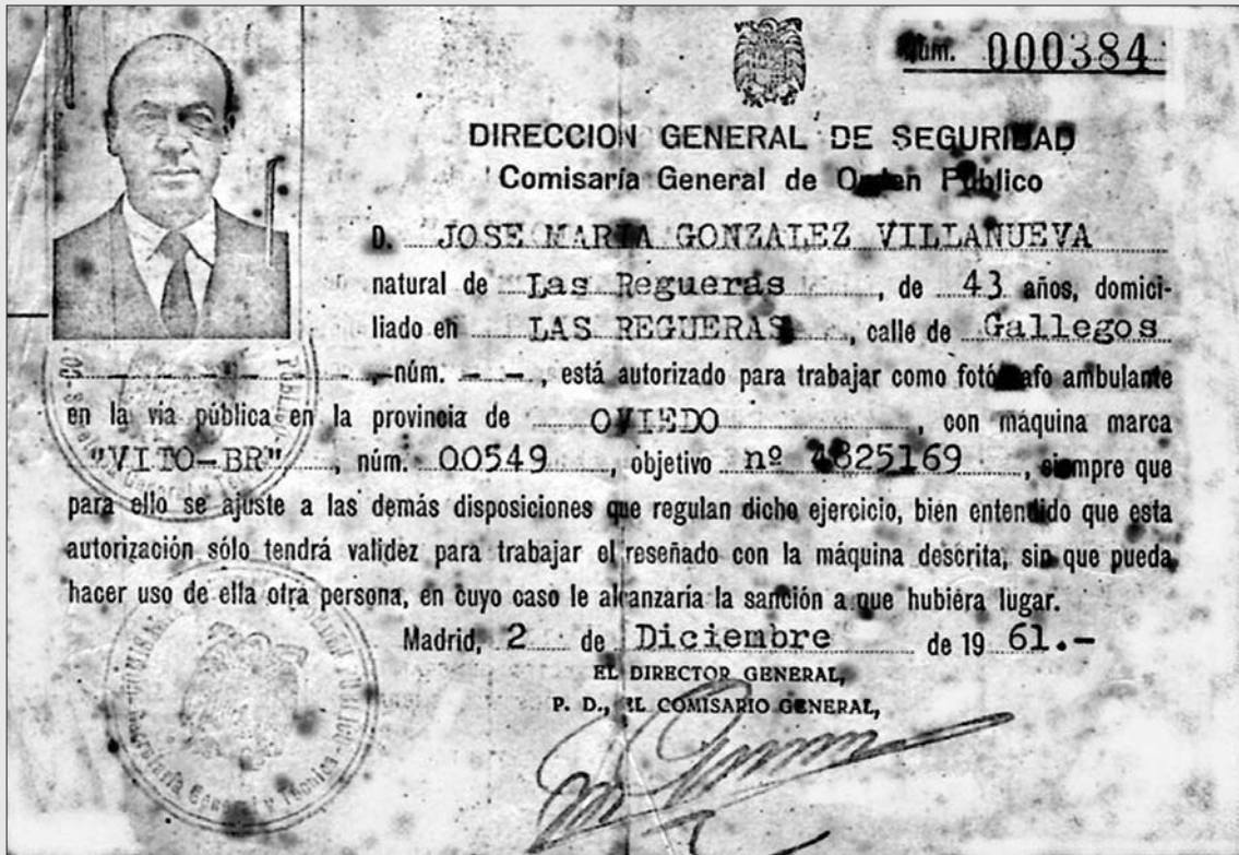
AUTORIZACIÓN PARA EJERCER COMO FOTÓGRAFO.

Muy trabajador, alto, de buena presencia, siempre impecablemente vestido, se ignora el móvil de su inclinación hacia la fotografía en la que sería tan destacado profesional.