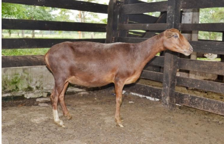
Figura 6. Características morfoestructurales del tronco de la Camura