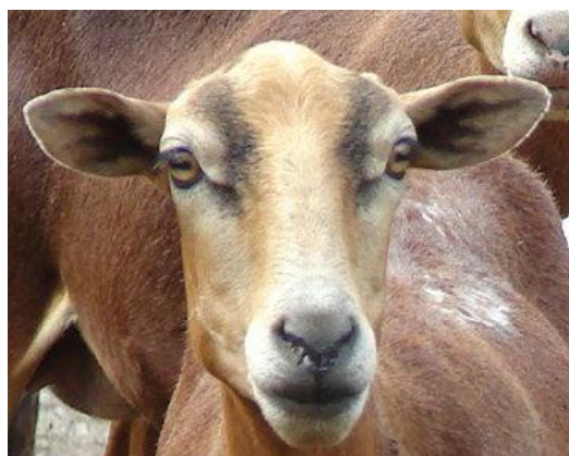
Figura 4. Características morfoestructurales de la cabeza de la Camura

Las orejas en su mayoría son horizontales (99,04%) y un pequeño porcentaje presenta orejas caídas (0,96%); tienden a ser de tamaño pequeño (53,05%) a mediano (46,3%) y solo una pequeña proporción (0,64%) presenta orejas grandes. BRAVO y SEPÚLVEDA (2010) afirmaron que la ubicación de las orejas de forma horizontal y de mediana longitud está correlacionada con el perfil cefálico recto y frente ancha, concordando con las características morfológicas de la Camura encontradas en el presente estudio (Fig. 4).