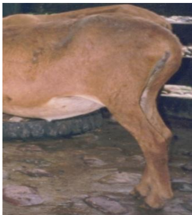
Figura 3. Características morfoestructurales de las extremidades posteriores de la Camura

En la Tabla 2, se observa la frecuencia de algunos caracteres morfológicos de la Camura. La muestra de ovejas evaluadas se caracterizó por mostrar línea dorso-lumbar descendente hacia la grupa, clasificándose como grupa inclinada ( 25-37^\circ ), en este caso, la tuberosidad isquiática (punta de la nalga), desciende levemente, contribuyendo a la inclinación de la grupa (97,4%). Este tipo de anca está determinada por la posición de la cadera, donde la tuberosidad isquiática está por debajo de la línea de la tuberosidad coxal, facilitando el trabajo de parto. El tipo de inclinación presentado en la grupa de las Camura, con presencia de buena longitud en los músculos de la nalga, permite movimientos rápidos en estos animales, sobre todo si forma un triángulo isósceles entre las líneas que unen la tuberosidad coxal (anca), tuberosidad isquiática (punta de la nalga), y rótula (SÁNCHEZ et al. , 2009).