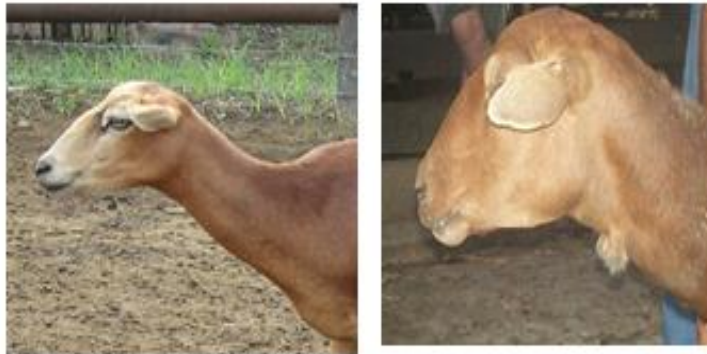
Figura 5. Características morfoestructurales del cuello de la Camura

Toda la población presentó un cuello de aspecto generalmente largo, delgado, fino y poco musculoso (Fig. 5).