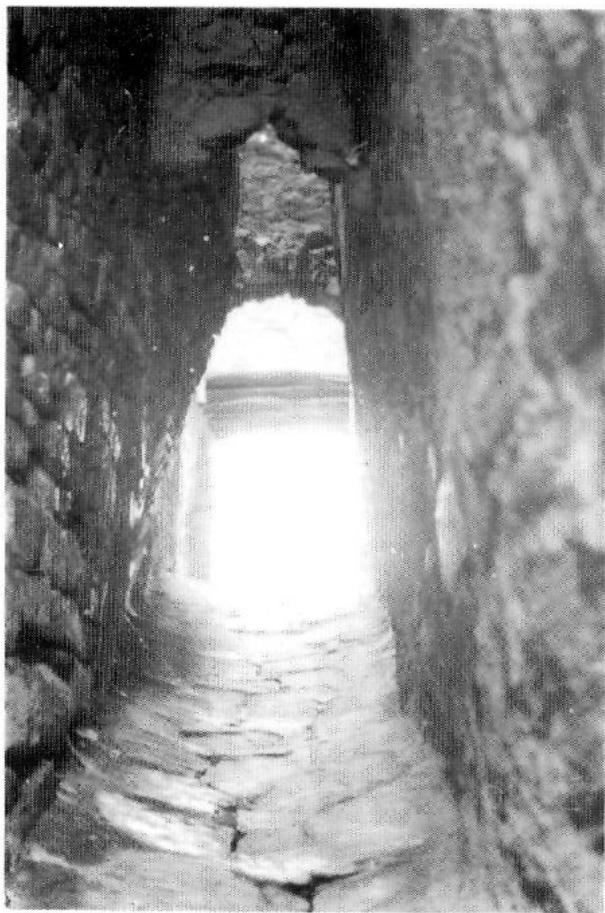
Els carrers dels Jueus, segons la tradició a Sarral.