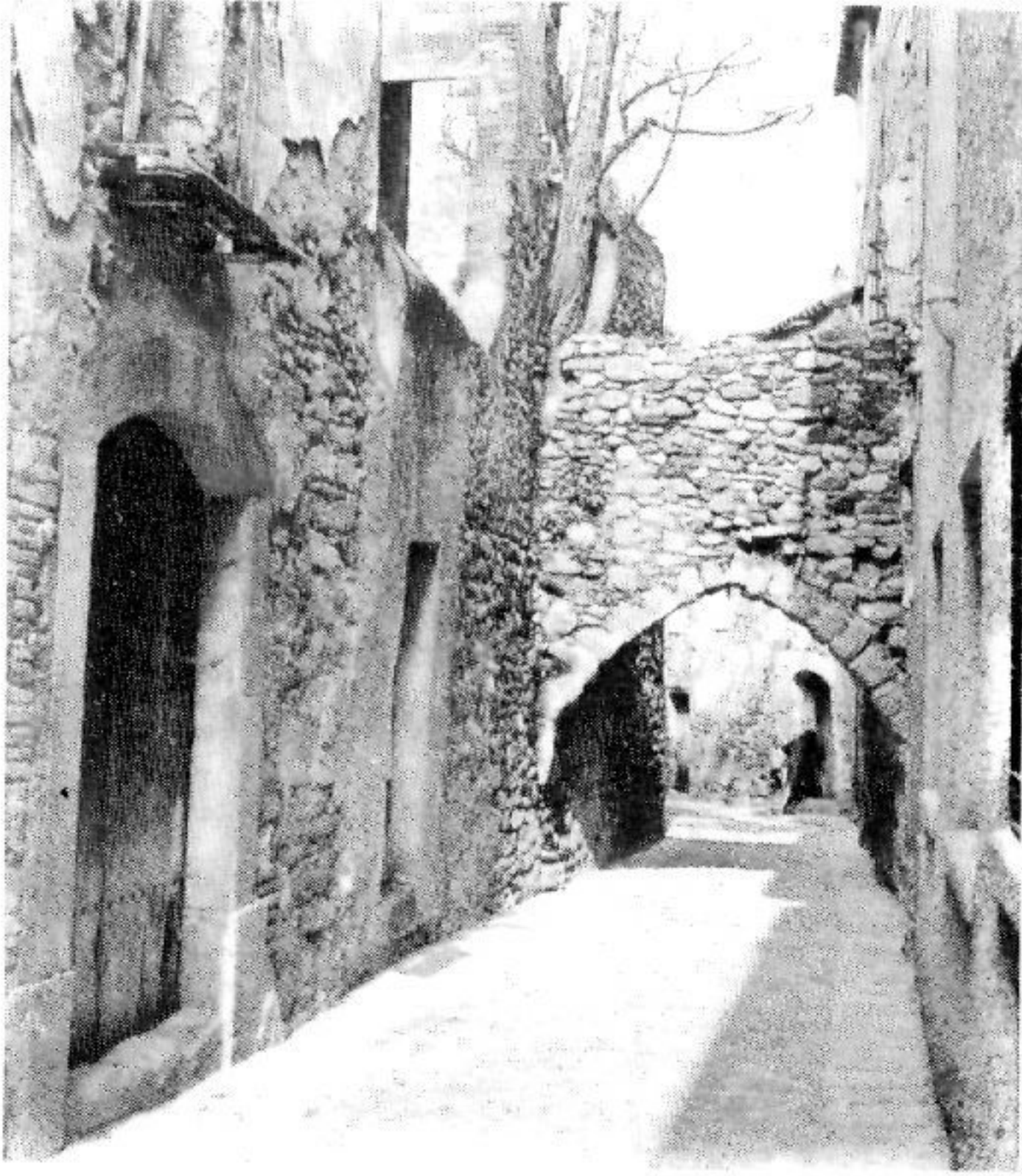
El carrer dels jueus de Montblanc.