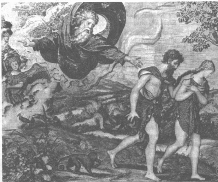
TAPIZ. FLANDES (SIGLO XVI)

En la economía básica de la vida, observamos que para que unos ganen tienen que perder otros, de lo cual puede derivarse una explicación que se constata empíricamente contemplando en nuestro alrededor la evolución nor-