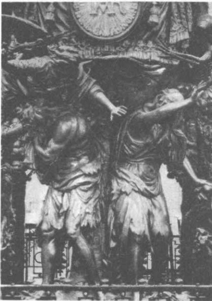
H. F. VERBRUGGEN. SANTA GÚDULA. FLANDES (S. XVI)

Se lo que es la psicología; con su ejercicio me gano modestamente la vida y ejerzo una vocación. La ética me acompaña desde hace muchos años, me obliga a andar derecho, a no dejar crecer en forma desmedida mi cuenta bancaria, me mantiene libre de sentimientos de culpa y hace que todos los días, al cepillarme los dientes, pueda mirarme en el espejo sin que me dé vergüenza.