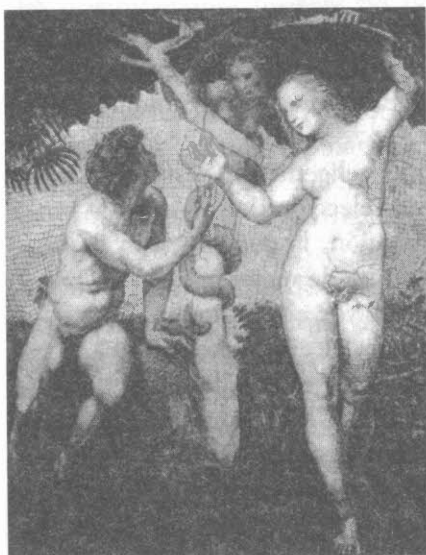
RAFAEL. ITALIA (S. XVI)

Resulta pues importante subrayar hasta que punto está en estos asentamientos marginales representado el "principio de rendimiento" que impera en todos los recodos de la sociedad actual. Tan marginales son los chicos y las chicas de las barriadas periféricas como la "juventud dorada" de los clubes exclusivos. En ambos la figura paterna está virtualmente ausente y los límites que se encuentran son simplemente los del dinero o los de la fuerza, según el caso. No hay una diferencia sustantiva entre el sometimiento por el miedo a la fuerza o por la codicia del dinero. Tanto una imposición como la otra resultan a la postre violentas.