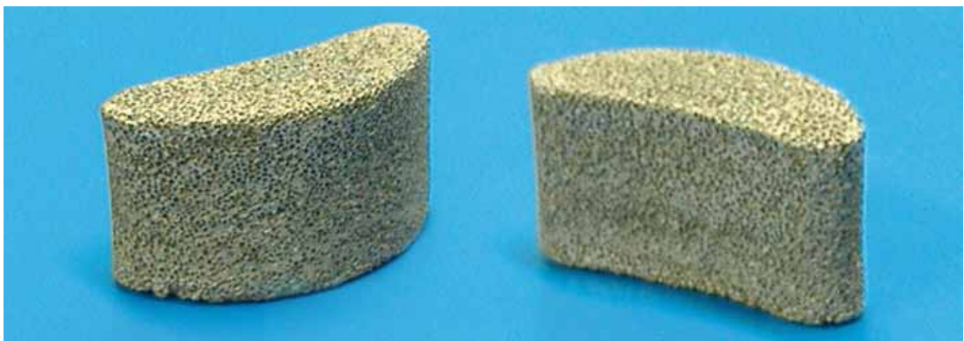
Figura 2. Modelo experimental seleccionado. Caja intersomática para columna lumbar.

En cuanto a la evaluación biológica, se llevó a cabo la implantación in vivo de muestras de la espuma de titanio desarrollada con el objetivo de evaluar la capacidad de osteointegración