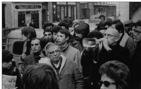
Foucault con un megáfono en una manifestación junto a Sartre. París, 1972.

Nace en 1926 en Poitiers en el seno de una familia acomodada de clase media y en la que la profesión médica (su padre fue cirujano) dejó una larga estela, aunque no suficiente para que se inclinara por esos estudios. Alumno brillante durante su bachillerato, se prepara en 1945 para ingresar en la École Normal Supérieur de París, laboratorio de las elites intelectuales francesas, donde se relaciona con lo más granado de los maestros del pensamiento de la época. Se licencia en Psicología y Filosofía. En 1951 aprueba la agregación y se incorpora como profesor de Psicología en la Universidad de Lille. Entre 1950 y 1953, siguiendo una pauta no infrecuente entre la intelectualidad de entonces, se afilia al Partido Comunista de Francia. En 1961, bajo la tutela de Georges Canguilhem, elabora su tesis principal de doctorado, Raison et déraison. Histoire de la folie à l'âge classique . Durante los años sesenta, cuando su actitud política resulta menos comprometida y no del todo ajena al poder establecido, coincidente con la llamada fase arqueológica de su obra, desempeña tareas como lector o como profesor en Upsala, Varsovia, Hamburgo, Clermont Ferrand y Túnez. A finales de 1968, pasados ya los sucesos del mayo francés, acepta destino docente en París, en la recién creada Universidad de Vincennes, verdadero centro experimental y foco de resistencia política e intelectual, donde destaca como intelectual vinculado a