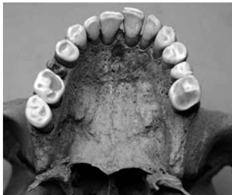
Fotografía 1: Dentición maxilar del individuo C.F. 67 (adulto, alofiso), en la que se observa un desgaste de los primeros molares grado 5 (Brothwell, 1987).

porcionándonos edad, sexo, estatura,...), complementados por el análisis paleopatológico, procesos tafonómicos, procesos posicionales y post deposicionales, etc., pueden ampliarse con un sinnúmero de métodos químicos que nos aporten información desde la composición química del hueso y el grado de alteración del mismo, hasta el conocimiento de la dieta que llevaban a cabo las poblaciones en el pasado, pasando por la caracterización del ADN de un individuo preservado en uno de sus dientes. En las fotografías 1 y 2 se pueden observar las diferencias en el patrón de desgaste dental en el maxilar superior de dos individuos adultos, C.F. 67 y C.F. 102, de una necrópolis árabe en Málaga (siglo X), excavada en 2009 y en fase final del estudio antropológico y paleopatológico. Podemos intuir como la diferencia en la dieta de ambos individuos es notable.