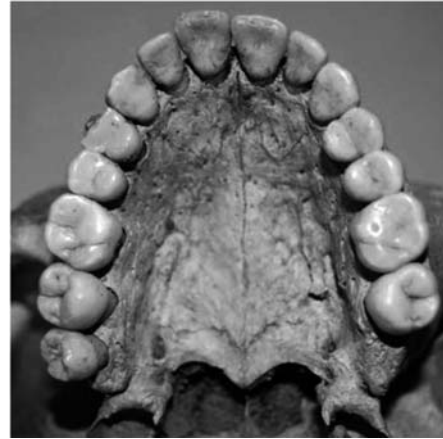
Fotografía 2: Dentición maxilar del individuo C.F. 102 (adulto, femenino) en la que se no observa desgaste reseñable de las piezas dentarias.

Desde mediados del pasado siglo XX, se han llevado a cabo multitud de estudios científicos paleoquímicos, que han proporcionado información sobre la composición químico-molecular de numerosos individuos, demostrando la existencia de una correlación directa entre la composición química del hueso y el tipo de economía que estos tenían, es decir, el consumo de productos vegetales y la ingesta de proteínas animales.