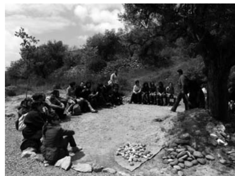
Figura 2. Joves, i no tan joves, desenvolupen l'empatia treballant en l'experimentació amb lítics (Aut: Noèlia Pérez Martínez)(Aut: Marta Farràs Drago)

En aquest camp es duen a terme diverses activitats centrades en alguns jaciments arqueològics propers, reals o recreats, basades en els principis d'interacció de l'alumnat amb el medi i de reconstrucció de diverses societats temporalment diferenciades. Respecte a la qüestió de l'Arqueologia experimental, el treball amb materials lítics (figura 2), la reconstrucció de cabanes o el treball de pells animals permeten a l'alumnat comprendre i avaluar l'organització complexa de l'activitat inclús a la Prehistòria. També per a potenciar aquest procés d'empatia històrica, des de la Noguera es proposa una visita i tot un seguit de treballs complementaris sobre