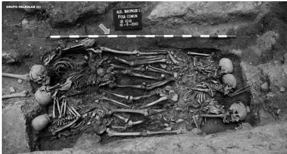
Figura 3. Fossa comuna amb diversos cossos en estudi a Albalat dels Tarongers, València

Rubial, 2010, pàg. 16). Les traves que els governs autonòmics, tant d'un signe polític com d'altre, posen a l'Arqueologia retirant-la dels canals oficials de subvenció en aquest tipus d'intervenció, no és sinó una extensió més d'aquesta violència ideològica característica del nostre ordre social actual, que nega l'existència d'una violència real durant el règim franquista en contra d'un grup per qüestions socials, polítiques i ideològiques. No es tracta d'un consens del perdó, sinó de la manca de coratge per enfrontar de nou dues concepcions d'estat contraposades i antagòniques. És la tasca de l'Arqueologia ser present en aquest debat, fornir d'explicacions i proves la memòria col·lectiva desapareguda i aquella que ha estat escrita amb una clara vocació propagandística per un règim antidemocràtic, i deixar que la societat prengui les seves pròpies decisions