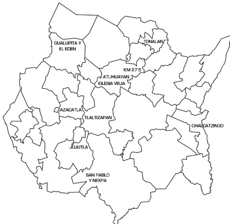
Figura 1.- Plano del estado de Morelos con la distribución de los sitios preclásicos más importantes conocidos hasta el momento (Tomado y modificado de http://www.estadodemorelos.mexicoclasico.com/mapa-morelos.jpg ).

como un bello pendiente hecho con la valva de una concha grabada (Grove, 1971). Otros importantes yacimientos que desafortunadamente no han sido excavados extensivamente, pero en los que se han exhumados materiales muy interesantes y de valor arqueológico indiscutible son Iglesia Vieja (Grennes-Ravitz, 1974) y Atlihuayán (Piña Chán y López, 1952) ambos localizados en el centro de Morelos y con artículos de las culturas tlatilquense y tenocelome (Figura 1).