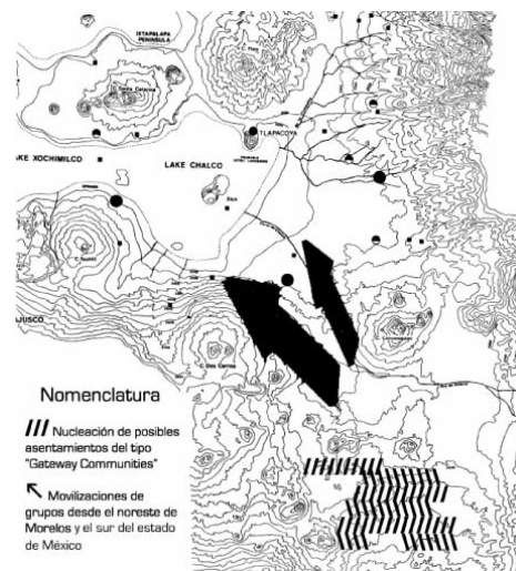
Figura 2.- Asentamientos del Formativo y movilizaciones de grupos indígenas durante el Preclásico Medio, a través del sur de la Cuenca de México (Tomado y modificado de Sanders, Parsons y Santley, 1979: Map 8, First Intermediate Phase One ).

asentamiento y la movilidad de los grupos. Se debe señalar que en los informes de Nalda existe una considerable omisión de información con respecto a la temporalidad de cada uno de los asentamientos registrados en campo, ya que de las tres áreas visitadas a pie solamente del Corredor Sur se indica claramente la temporalidad de los 99 sitios -el autor insertó los sitios formativos del Corredor Sur en tres divisiones temporales del Preclásico: Medio, Tardío y Terminal, teniendo 40 sitios con material de esta época para el primer caso, 43 sitios para el segundo y 51 para el tercero y último (Nalda et al., 1986)-. Al momento de consultar el citado trabajo de Nalda resulta evidente un conjunto de yacimientos agrupados en un área específica con materiales tan diversos que abarcan los tres principales períodos de la historia prehispánica y que resultan relevantes para entender el valor sociocultural de la región bajo nuestro estudio; se trata del gran valle comprendido en el interior del estado de México entre las actuales poblaciones de Atlautla y Tepetlixpa al sur –este/oeste respectivamente- y Juchitepec de Mariano Rivapalacio al norte, con aproximadamente 60 sitios arqueológicos identificados entre los que existen unos cuantos con considerable presencia arquitectónica, siendo un caso aparte el sitio No. 49-43 (1-3), emplazado fuera del núcleo principal aunque ubicado entre las poblaciones de Tepetlixpa y Nepantla, y que sobre-