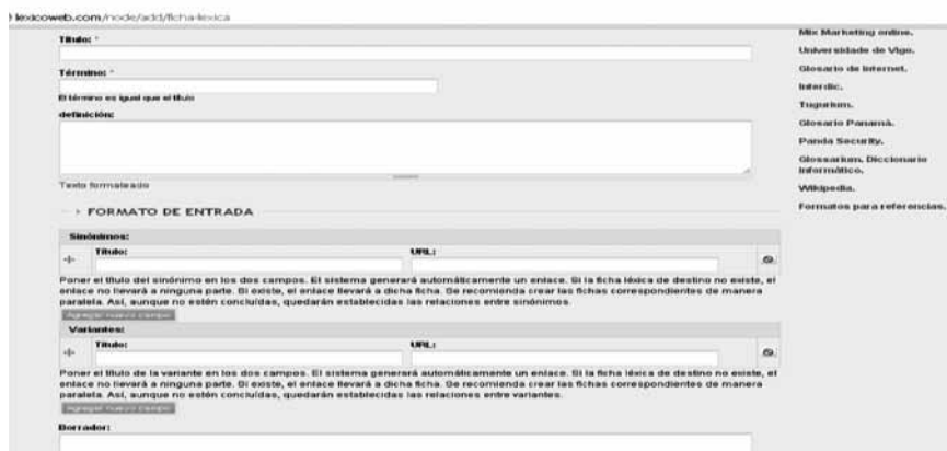
Gráfico 6. Información básica

Respecto a la definición, por el momento se está tomando de fuentes lexicográficas ya existentes, tales como el DRAE (vigésima segunda edición, 2001), el CLAVE (2006), el Diccionario Manual de la Lengua Española VOX (2007) y el Diccionario Enciclopédico VOX (2009), también de glosarios específicos. Posteriormente, propondremos una definición según el contexto lingüístico en el que se encuentren los términos.