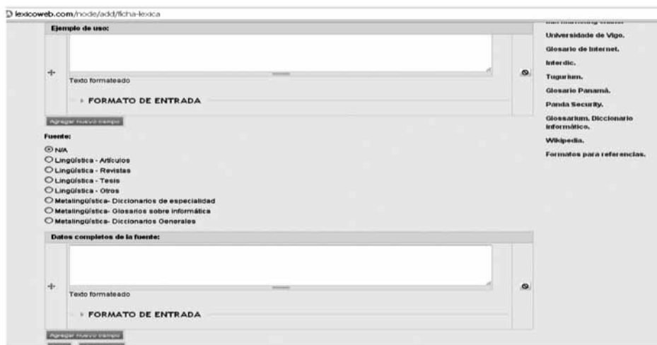
Gráfico 7. Fuentes

En la siguiente pestaña, denominada “fuentes”, se presentan los ejemplos, el tipo de fuente y los datos de los documentos de los que se han tomado dichos ejemplos (ver gráfico 7). Se procura incluir al menos un ejemplo de cada país y de cada tipo de fuente que refleje el uso de los términos que se pretenden ilustrar; esto es posible gracias a una función que permite “agregar nuevo campo”.