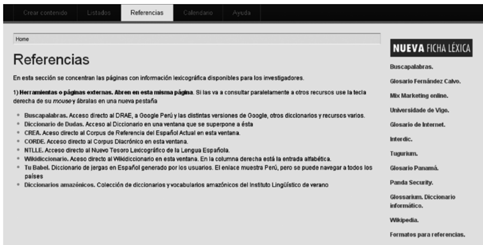
Gráfico 5. Referencias