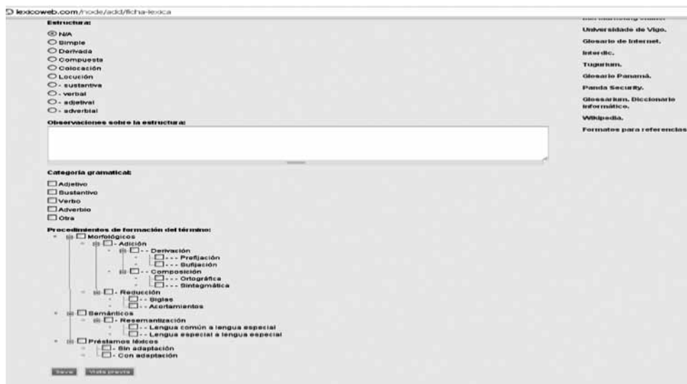
Gráfico 8. Información sobre el término