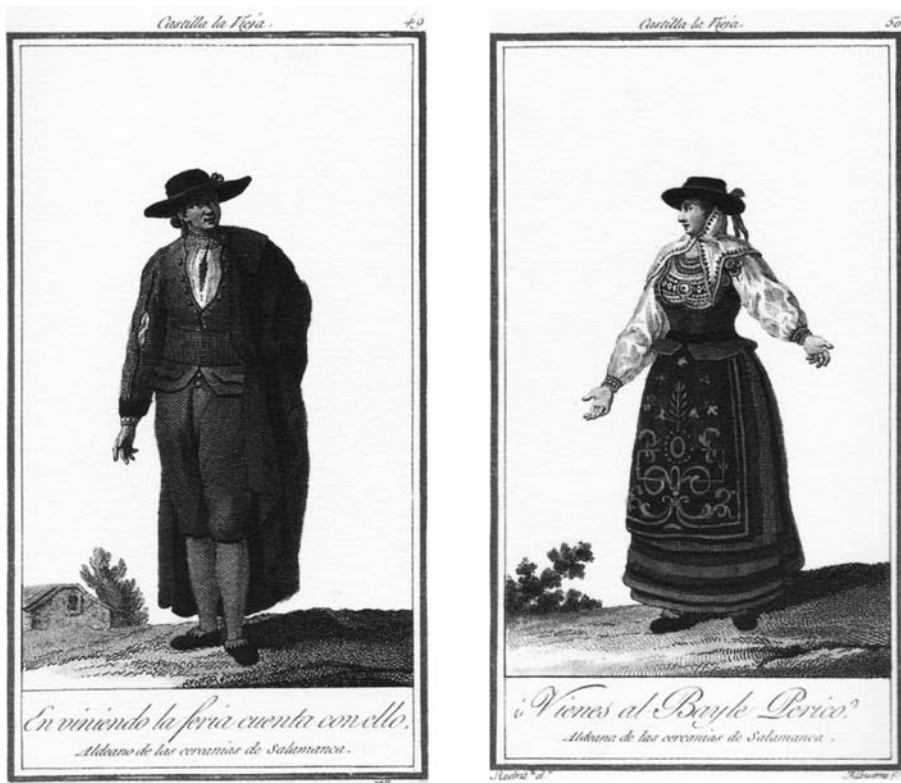
Fig. 2. A la derecha, “¿Vienes al Bayle Perico? Aldeana charra del partido de Salamanca”; a la izquierda, “Aldeano charro de los caseríos de Salamanca”. Grabados de Juan de la Cruz Cano y Olmedilla. Nótese que los títulos de ambas imágenes establecen un diálogo que destaca el habla “vulgar” charra 13 .

El cronista no se atrevería jamás a afirmarlo, pero hay respetables indicios para suponerlo.