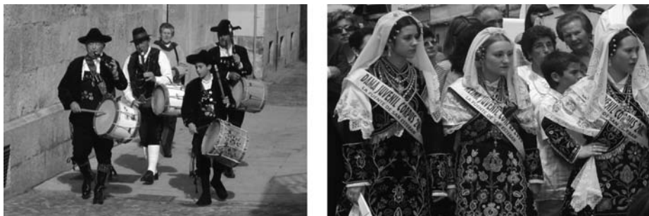
Fig. 9. A la izquierda, pasacalles charro en Ciudad Rodrigo; a la derecha, Reina Juvenil de Corpus en Fuente de San Esteban.

patriotismo. Salamanca se unió a este proyecto nacional creando diferentes grupos de coros y danzas locales 67 .