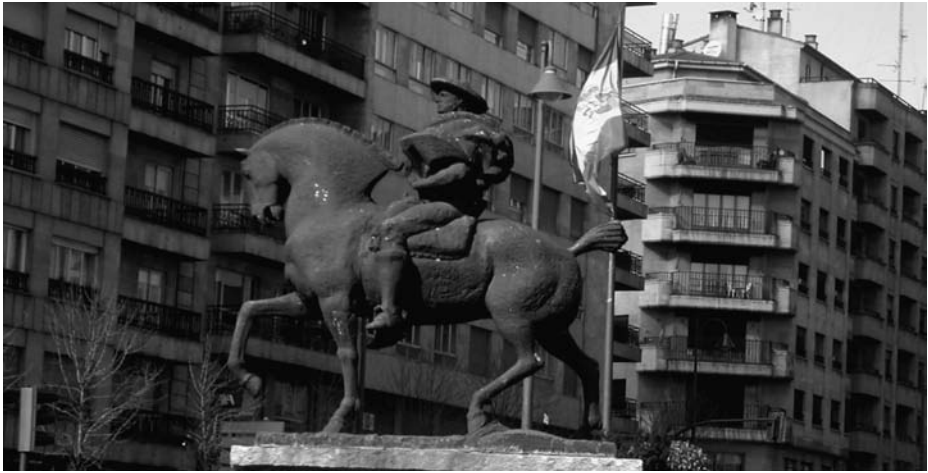
Fig. 4. El vaquero charro, escultura de Venancio Blanco (1985) en la Plaza España de la ciudad de Salamanca.

La postura de este autor es la más recurrente de la época: por un lado, se trata de identificar a los charros como un sector próspero y rescatar de éste algunos elementos que contribuyeran a mantener una figura particular y representativa de la provincia; por otra parte, el cambio se ve como el triunfo del progreso, el cual eliminaba prácticas que calificaban de “bárbaras” y creencias que consideraban simples “supersticiones”. En otras palabras, el propósito era conformar un símbolo provincial exento de los rasgos que podrían mostrarlo como incivilizado, pero sin perder aquellos elementos que lo remontaban al pasado, lo autóctono y lo pintoresco.