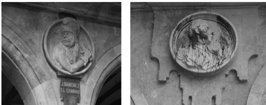
Fig. 8. Medallones de la plaza mayor de Salamanca. A izquierda, Julián Sánchez; a la derecha, Francisco Franco.