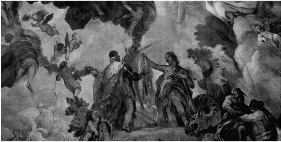
Fig. 1. Detalle de La alegoría del toisón de oro, donde Felipe el Bueno recibe el vellocino de manos de Hércules. Fresco de Luca Giordano (circa 1697) en el Casón del Buen Retiro.

Este tipo de fiestas eran elitistas. Si bien la gente del pueblo podía participar en los encierros corriendo con los toros, saltando a la plaza con sus capas o contemplando las corridas, ellos no tenían el protagonismo. De hecho, estaban más cerca de ser equiparados a los bovinos por sus costumbres y creencias consideradas “bárbaras” y “heréticas”. Como podemos leer en el aplauso poético escrito por Gaspar de Velasco, con motivo de la consagración de la catedral de Salamanca en 1733, a los aldeanos salmantinos se les consideraba incapaces de comprender las corridas caballerescas. El poema habla de un grupo de charros que asistieron a estas festividades, de quienes se dice que: