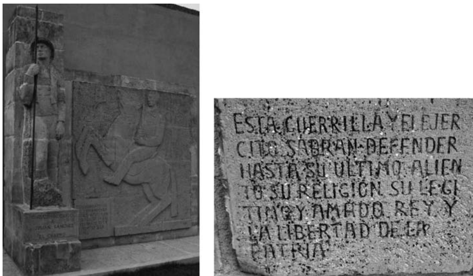
Fig. 7. Monumento e inscripción en la tumba de Julián Sánchez “El Charro”, Ciudad Rodrigo, Salamanca, 2007. En la inscripción se puede leer: “Esta guerrilla y el ejército sabrán defender hasta su último aliento su religión, su legítimo y amado rey y la libertad de la patria”.

seductores, un emblema de lo autóctono, al que se le atribuyó cierta nobleza gracias a su participación en la guerra, considerada una nueva cruzada contra la herejía. Años más tarde un nuevo espíritu cruzado invocaría nuevamente a la lucha y utilizaría el folclor como una herramienta para sus propósitos, impulsando la reformulación de elementos tradicionales para su uso político.