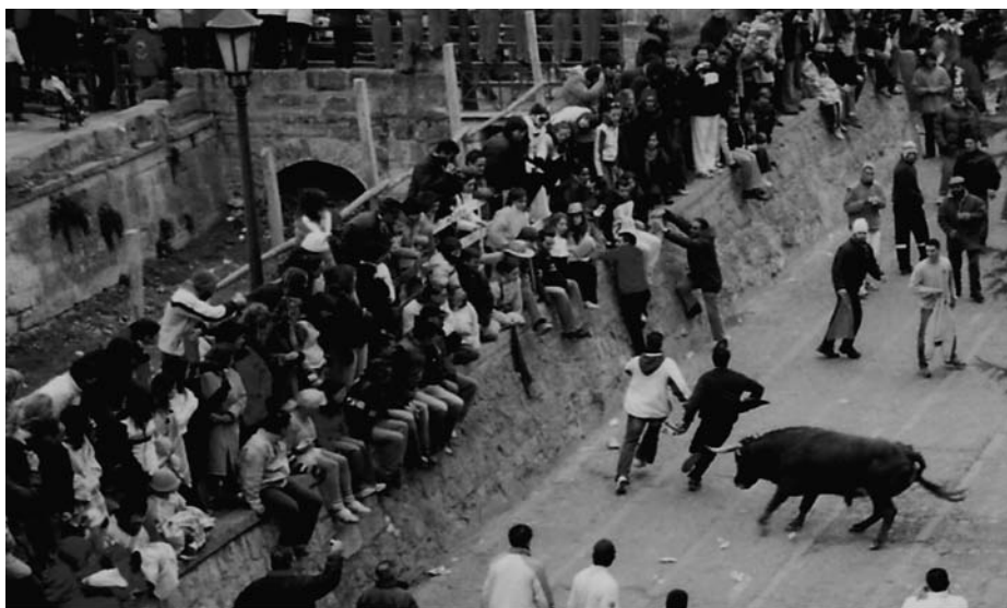
Fig. 5. Encierro en el Carnaval del Toro, Ciudad Rodrigo, Salamanca, 2005.

Todas las fiestas populares que acabamos de mencionar fueron atacadas en el mismo sentido. Algunas desaparecieron, otras se conservaron o se reinstauraron, asumiendo la categoría de patrimonio cultural, conservándolas como resabio de un pasado “primitivo” y elemento propiamente autóctono. Actualmente, las principales celebraciones taurinas salmantinas consisten principalmente en encierros y capeas que se combinan con corridas al estilo andaluz.