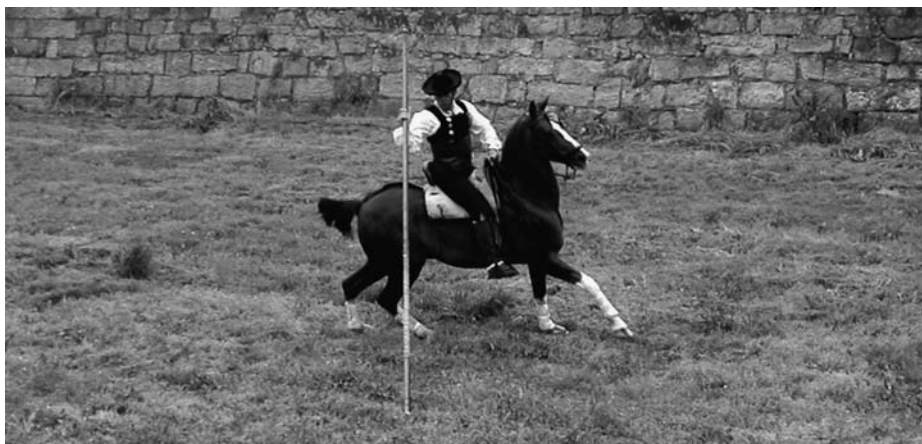
Fig. 3. Jinete charro en una exhibición de doma vaquera, Ciudad Rodrigo, Salamanca, 2005.

aun, el Conde de las Almenas creyó encontrar en estos “juegos salmantinos” el génesis de la “fiesta nacional” 26 .