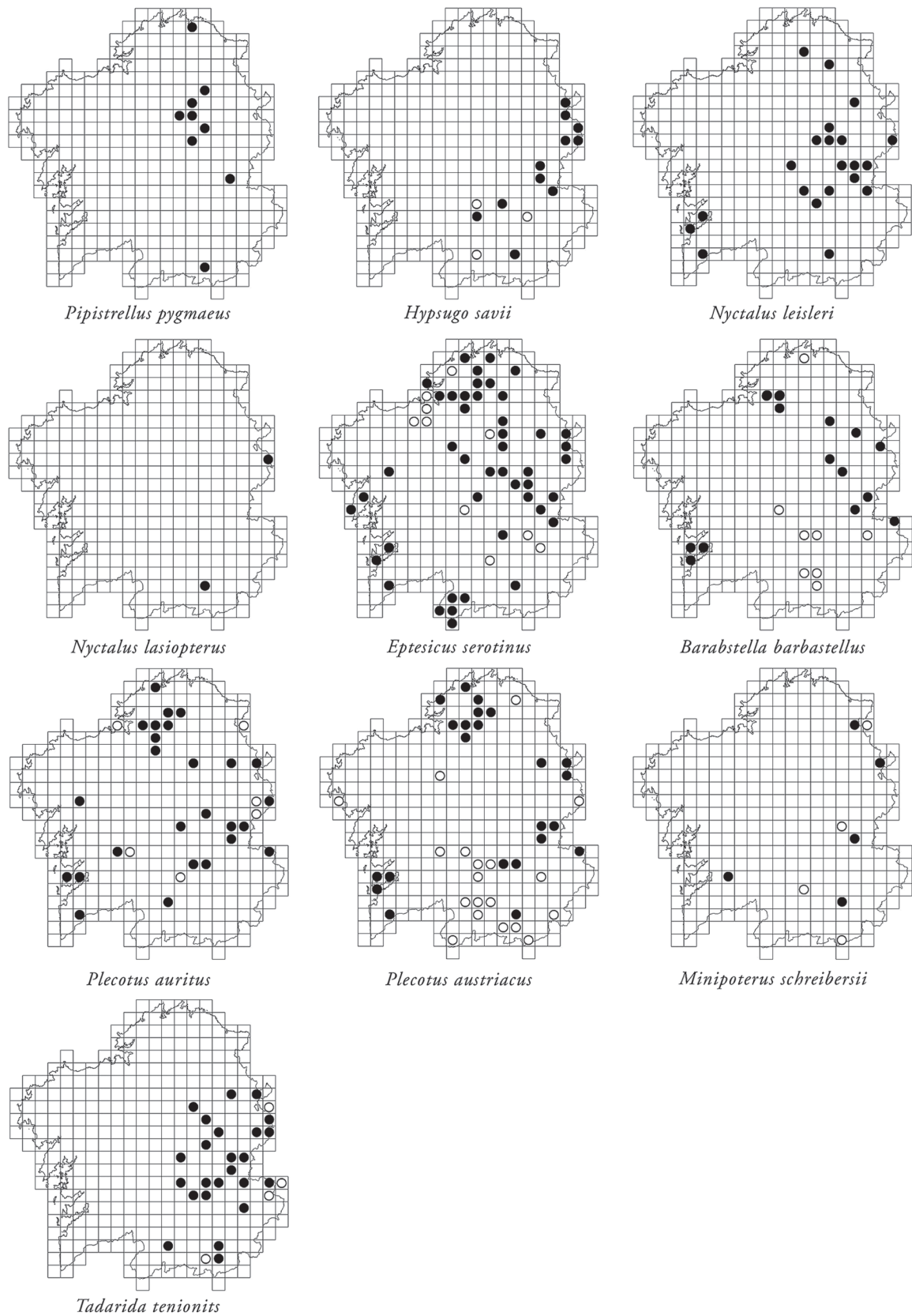
Figura 1 (continuación). Mapas de distribución (cuadrículas UTM de 10x10 km) de los quirópteros en Galicia. Los círculos blancos representan la información disponible en la bibliografía y los círculos negros las nuevas citas aportadas en el presente estudio.