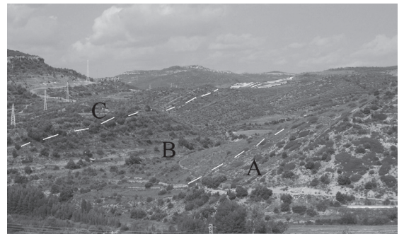
Figura 2 | Foto panoràmica del jaciment del Barranc de la Torre Folch. A) Formació Margues i calcàries de les Artoles. B) Fm. Argiles de Morella. C) Fm. Calcàries i margues de Xert.

Pel damunt es troben 78 metres d'una alternança de trams de lutites (rogenques i grises) amb alguna passada calcària i trams predominantment arenosos amb cossos de morfologia lenticular. Les arenen presenten estratificacions encruades planars i de solc, així com laminació planar. Sovint s'aprecien nivells de microconglomerats a la base dels canals i bioturbació al sostre. La granulometria és de fina a mitja. La part mitja i superior d'aquesta unitat presenta fragments carbonosos vegetals. S'observa també un canvi en la coloració dels cossos arenosos, grisencs a la part baixa i ocres cap als 2/3 superiors, denotant condicions d'ambient sedimentaris de menor profunditat de làmina d'aigua a la base de la formació. Aquesta unitat s'interpreta com una plana deltaica d'inundació amb influència mareal, (Salas,