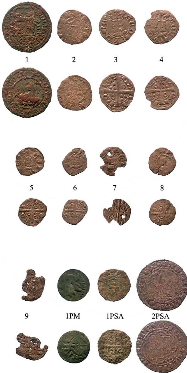
Monedes trobades al carrer de la Font, la plaça Major i el portal de Sant Antoni seguint l'ordre del catàleg.